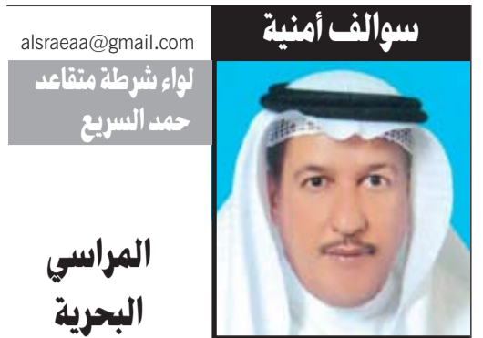
سواء أمنية لواء شرطة متقاعد حمد السريع

كاد حريق مخزن للاخشاب والمواد سريعة الاشتعال ان يتسبب في كارثة بعد اندلاع النيران به وهو ما أدى الى تدافع كمي من السحب الدخانية التي البناية كما كشف الحريق عن مخالفة جسيمة تمثلت في استخدام السرداب في تخزين الاخشاب والمواد سريعة الاشتعال وهو ما يعد مخالفة جسيمة. وحسب مدير العلاقات العامة في الاطفاء المقدم خليل الامير فان بلاغاً ورد الى غرفة عمليات الإدارة العامة للإطفاء عن اندلاع حريق في سرداب عمارة سكنية تتكون من 9 ادوار وكان الحريق بمساحة 500 متر مربع، وازداد المقدم الامير على الفور اتجه مركز اطفاء حولي والسائلة الجنوبي والشمالي الى مكان الحادث وتم اخلاء المبني من السكان ومكافحة الحريق حيث تبين ان السرداب غير مخصص وتم استخدامه للتخزين وتوجد به اخشاب ومواد بلاستيك وغيرها من المواد