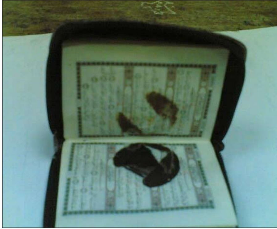
الحشيش وقد اخفي في كتاب الله بطريقة مبتكرة

أمر مدير عام الإدارة العامة للجمارك بإحالة مواطن تم القبض عليه محاولاً تهريب قطعة من مادة الحشيش بطريقة غير آمنة حيثما أخفى تلك السموم المخدرة في كتاب الله وحسب مصدر جرمي فإن فرقة الاثر بقيادة عبداللطيف السندي اشتبهت فسي مواطن قدم للسي البلاد يوم امس عبر منفذ السالمي، وقال المصدر ان المواطن غير السوي تم الاشتباه به خلال انتهاء الاجراءات الجمركية وبتفتيش ابعده لم يعثر رجال الامن بها على أي مواد ممنوعة وبتفتيش كتاب الله الكريم السدي كان داخل السيارة تم العثور على قطع من الحشيش، وتمت إحالته الى الإدارة العامة لمكافحة المخدرات.