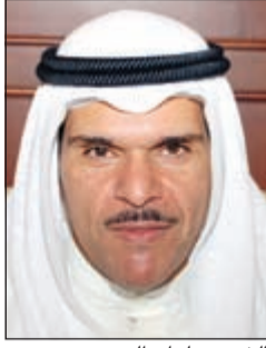
الشیخ سلمان الحمود

زار وزير الإعلام ووزير الدولة لشؤون الشباب الشيخ سلمان الحمود أمس الإعلامي عبدالعزیز الفیاض الذي يتلقى العلاج في المستشفى. ونقل وزير الإعلام خلال الزيارة تحيات سمو رئيس مجلس الوزراء الشيخ جابر المبارك للفياض وأمنيته بالشفاء العاجل، مشيراً إلى أن سموه تكفل بتحمل نفقات علاجه في الخارج. وقال الحمود ان مبادرة سمو رئيس الوزراء ليست بالأمر الجديد على سموه «وتتبع من إيمانه بأهميته دور الإعلام والإعلاميين وحرصه على تذليل الصعاب والعقبات التي تعترضهم». واطمأن على أحوال الإعلامي والمنيع القدير الفياض اثر الوعكة الصحية التي ألمت به وأدخل على أثرها المستشفى لتلقي العلاج. وأعرب وزير الإعلام عن خالص أمنيته للإعلامي الفياض بالشفاء العاجل بإذن الله ليعود الى أسرته وليواصل مسيرته الإعلامية في الإذاعة الكويتية.