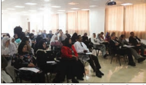
جانب من الحضور في الدورة التثقيبية الخامسة لعيادة الأصحاء