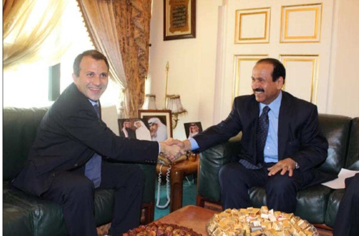
السفير السعودي علي عوض العسيري مستقبلاً الوزير جبران باسيل في مقر السفارة أمس

هي اجراء الانتخابات، ونفى ردا على سؤال اي فتور في العلاقة مع رئيس مجلس النواب نبيه بري. هذه الضائقة السياسية اعادت احياء اللجنة الفرعية المختصة للتوافق على قانون انتخابات وسيط رفض قوى 8 آذار ان تكون اجتماعاتها لتطبيع الوقت. واجتمعت اللجنة أمس بصورة تشاورية غير رسمية وبحثت في تفاصيل قوانين الانتخابات المختلفة وقررت تسمية نفسها لجنة تواصل نيابي وليست لجنة فرعية.