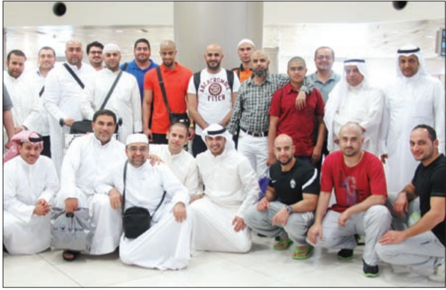
لقطة جماعية لموظفي زين المعتمرين