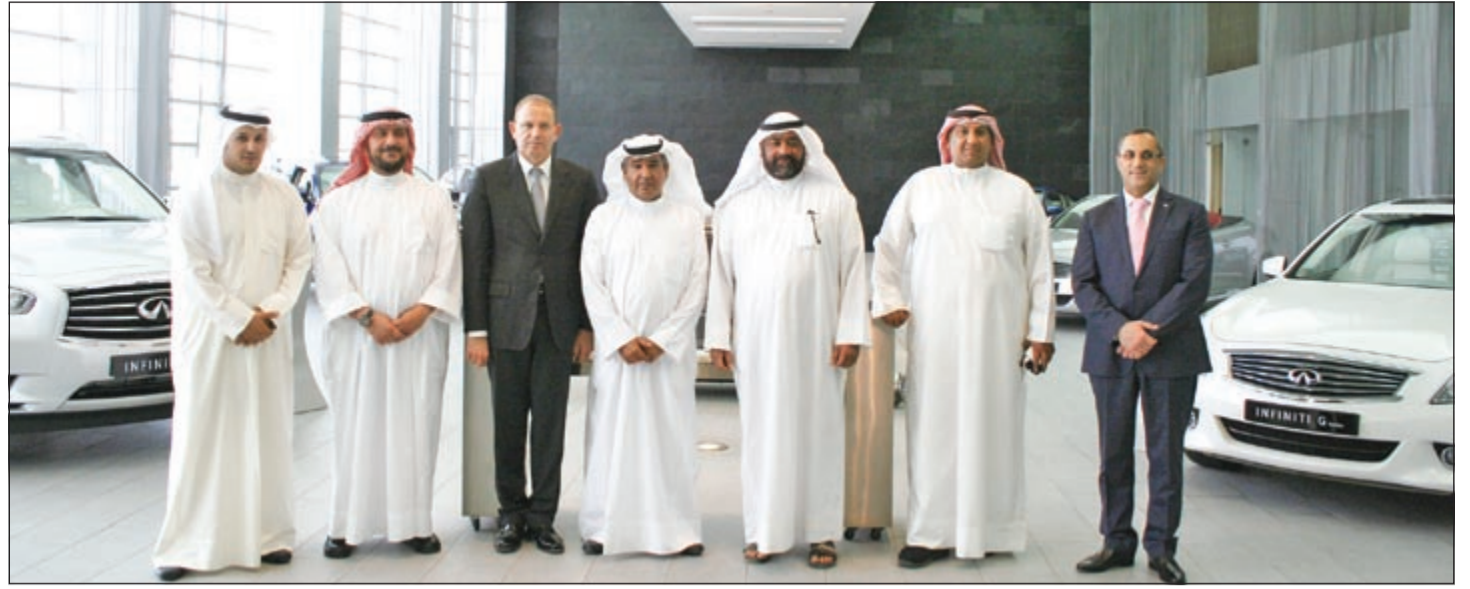
لقطة جماعية لمديري الشركتين