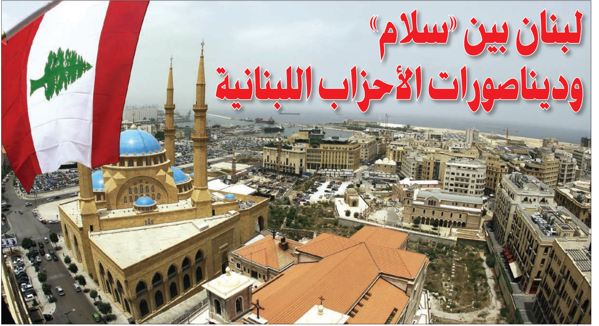
العاصمة بيروت الصامدة تستشرف المستقبل في عهد سلام