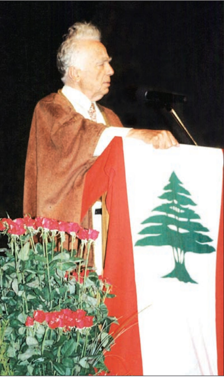
الأديب والشاعر اللبناني الكبير الأستاذ سعيد عقل ذو الـ 101 عام من العمر