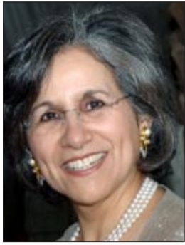
الشبيخة حصة الصباح

وسموها الإنساني»، تتناول فيها الدور الذي يلعبه الفن في تقاسم القيم بين الثقافات والأديان المختلفة، كما تناقش أيضاً الأثر أو «البصمة» التي يتركها الفنانون وجامعو التحف ومشاهدوها والعلماء المختصون في تعزيز الفهم التاريخي والمعاصر للحضارات المختلفة. وصرحت الشبيخة حصة قائلة: «لقد دعيت لهذا المؤتمر باعتباره حفلة لذاكرة التاريخ من خلال المجموعة والمتحف، وأنه فخري لي أن أشارك في هذا المحفل المهيّب، ولا شك في أن التنوع في المشاركين في هذا الحدث، أمر لافت ومثير للإعجاب في آن، وإنسي لعلي يقين بأنني