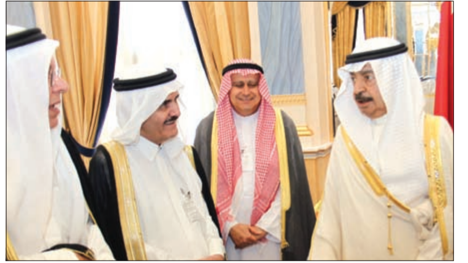
صاحب السمو الملكي الأمير خليفة بن سلمان مستقبلاً الزميلين تركي السديري وأحمد بهبهاني وأعضاء الاتحاد