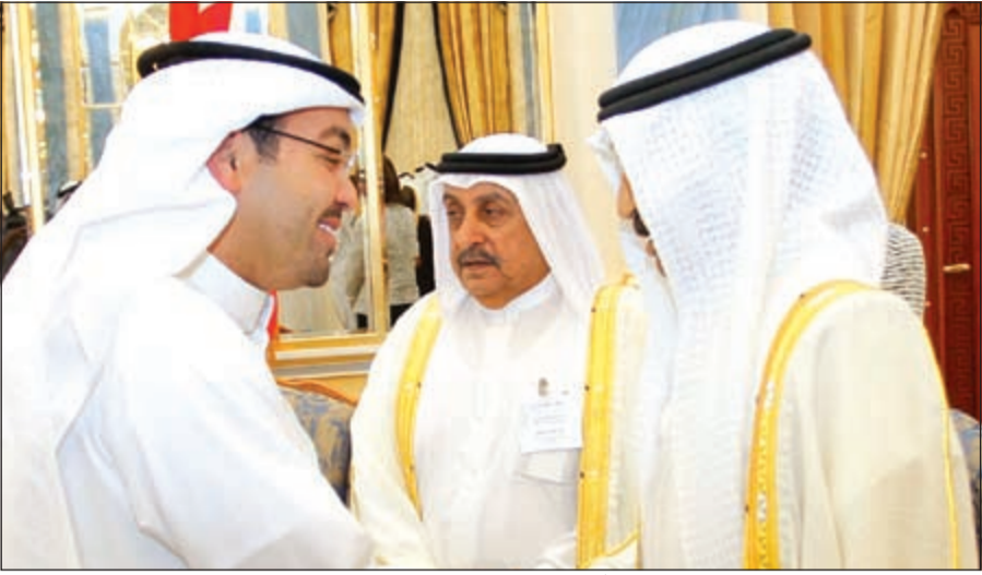
صاحب السمو الملكي الأمير خليفة بن سلمان آل خليفة مرحباً برئيس التحرير الزميل يوسف خالد المرزوق