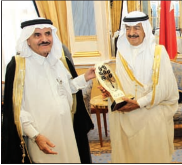
الأمير خليفة بن سلمان يتلقى درعاً تذكارية من تركي السديري