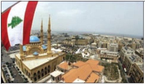
العاصمة بيروت الصاعدة تستشرف المستقبل في عهد سلام

لبنان بين «سلام» و«ديناصورات الأحزاب اللبنانية» ● بقلم: يوسف عبد الرحمن 26 27