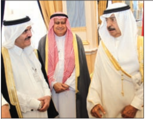
صاحب السمو الملكي الأمير خليفة بن سلمان مستقبلاً الزميلين تركي السديري وأحمد بهبهاني

رئيس وزراء البحرين: الاتحاد الخليجي بات مطلباً شعبياً 05