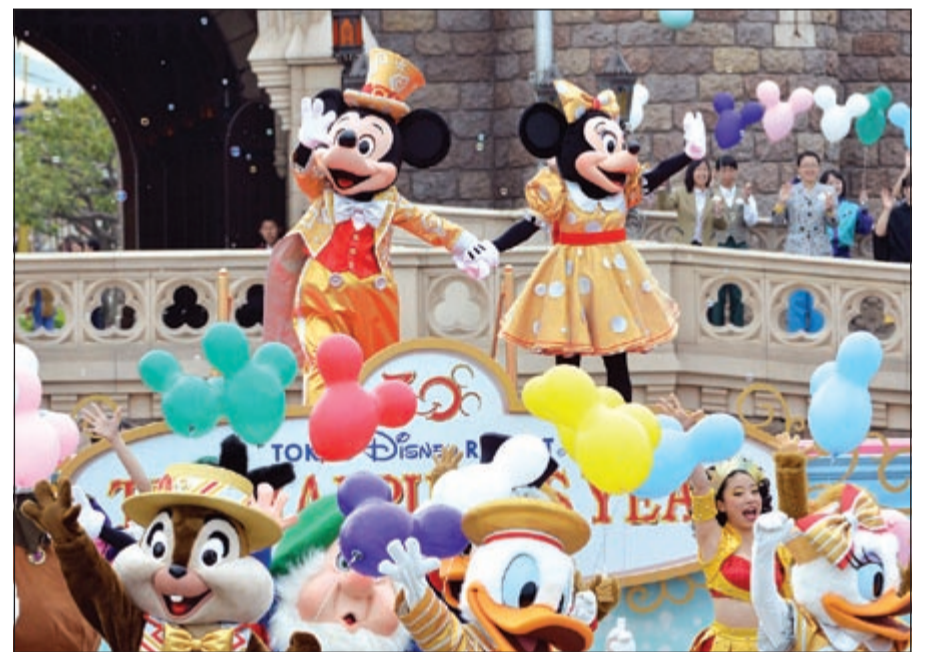
ديزني لاند في طوكيو

وقد استقبل المجمع السذي يضم موقعي طوكيو ديزني وديزني سي (افتتح العام 2001) 27,5 مليون زائر بين إبريل 2012 ومارس 2013 وهو عدد قياسي سنوي.