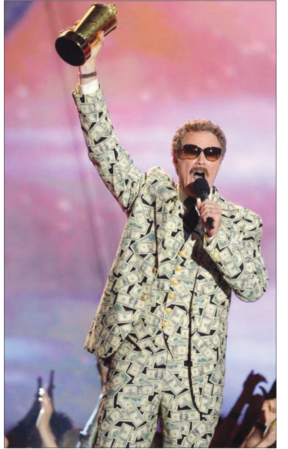
بدلة ويل فيريل بالدولارية

حطم شريط الفيديو الخاص بأغنية المغني الكوري الجنوبي ساي الجديدة، الرقم القياسي لعدد المرات التي شوهد فيها بعد أقل من يومين على بدء بثه، لكن من المبكر القول إن كان سيتجاوز شريط فيديو أغنيته السابقة «Gangnam Style» الذي شوهد أكثر من 1,5 مليار مرة. وقد شوهدت «جنتلمان» عشرين مليون مرة في الساعات الأربع والعشرين الأولى لمطعمه بذلك العدد القياسي المسجل باسم الكندي جاستن بيبير الذي شوهد شريط أغنيته «بوفرييند» ثمانية ملايين مرة في مايو 2012.