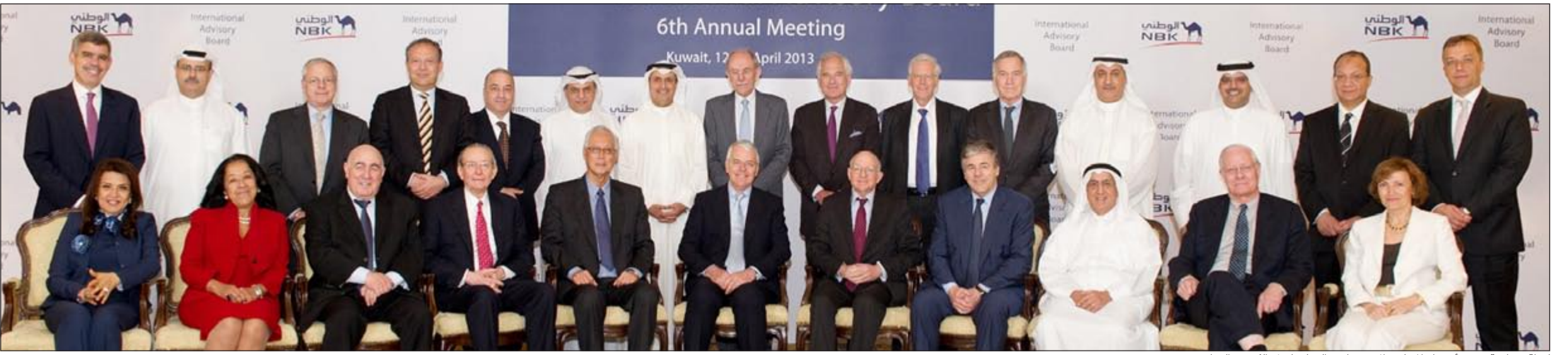
لقطة جماعية تضم أعضاء المجلس الاستشاري الدولي لبنك الكويت الوطني