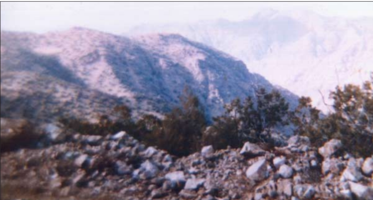
جبل الجودي حيث رست سفينة نوح