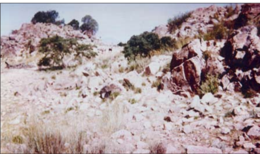
جانب من جبل الجودي