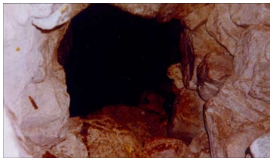
فتحة أسفل السفينة