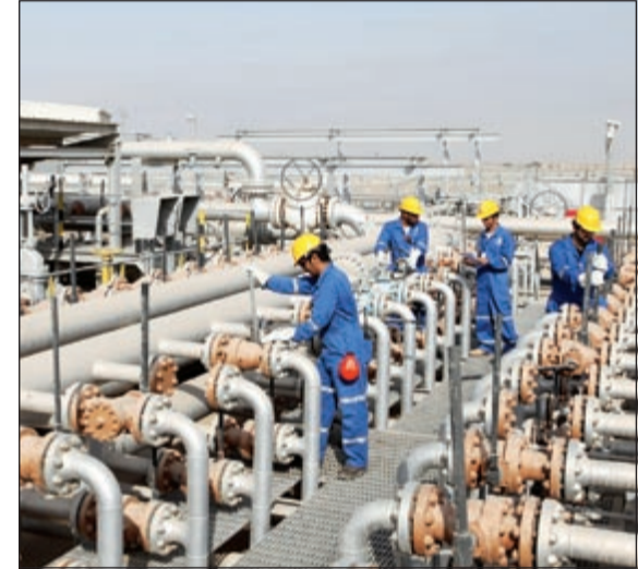
زيادة كبيرة في قيمة المشاريع التي وقعتها «نפט الكويت» خلال الربع الأول

5 عقود كاملة إلى الشركة الكويتية للحفريات بقيمة 94,3 مليون دينار.