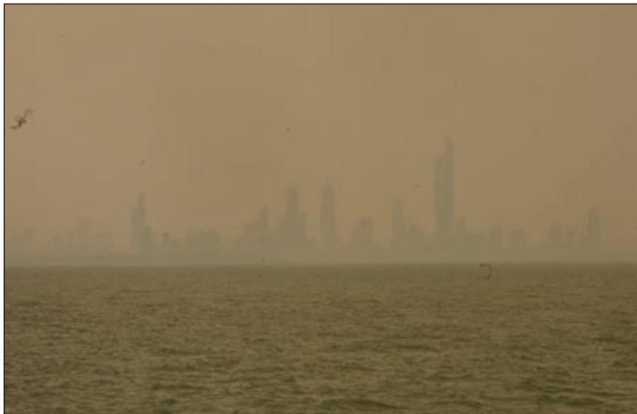
الرؤية انخفضت إلى مستويات متدنية

واضاف العجيري لـ«الأنباء»: ان هذه الفترة تسمى ببداية موسم السرايات وان الرياح والأمطار التي تأثرت بها البلاد ومتوقع استمرارها ناتجة عن أرياح جنوبية - شرقية مصدرها مدار السرطان. واكد ان ما شهدته البلاد امس من الظواهر الاعتيادية التي تتسم بعدم الاستقرار وتكون خليطاً من الهوا القوي المصاحب له برق وامطار.