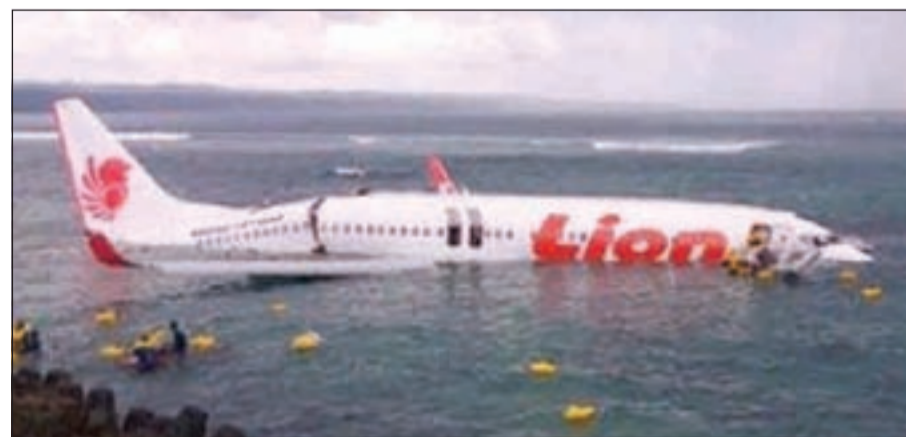
الطائرة بعد سقوطها في الماء

إندونيسيا - وكالات: في حادثة غريبة من نوعها سقطت طائرة نقل ركاب في البحر، إلا أن المفارقة كمنت في نجاة 130 شخصا كانوا على متنها. وأعلن مسؤول في وزارة النقل الإندونيسية أن طائرة تقل أكثر من 130 شخصا تجاوزت السببت مدرج الهبوط في مطار بالي الدولي، قبل أن تنسقط في البحر لكن جميع من كانوا على متنها نجوا.