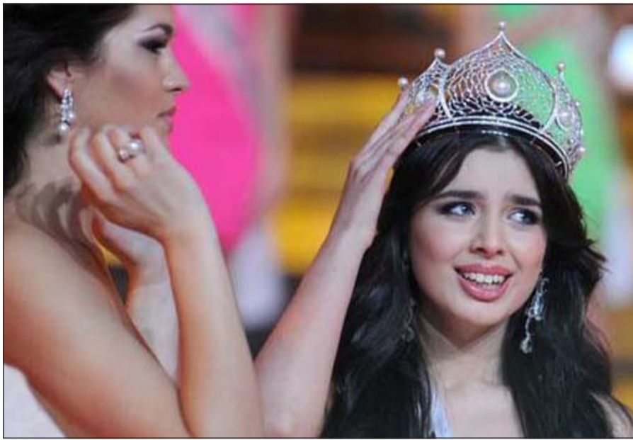
ملكة جمال روسيا إلميرا عبدالرازقوف

رغم الانتقادات العنصرية القاسية التي تعرضت لها بعد التربع على عرش الجمال الروسي، أبدت ملكة الجمال ذات الأصول التتارية فخرا مجدداً باللقب الروسي.