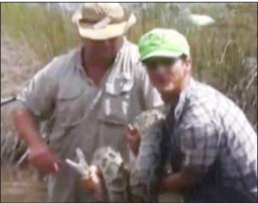
الأميركي يحمل الثعبان مقتولا

تمكن شاب أميركي من قتل ثعبان بطول ثلاثة أمتار مستخدماً يديه فقط، وذلك بعد أن قام بملاحقة الثعبان ومصارعته داخل المياه.