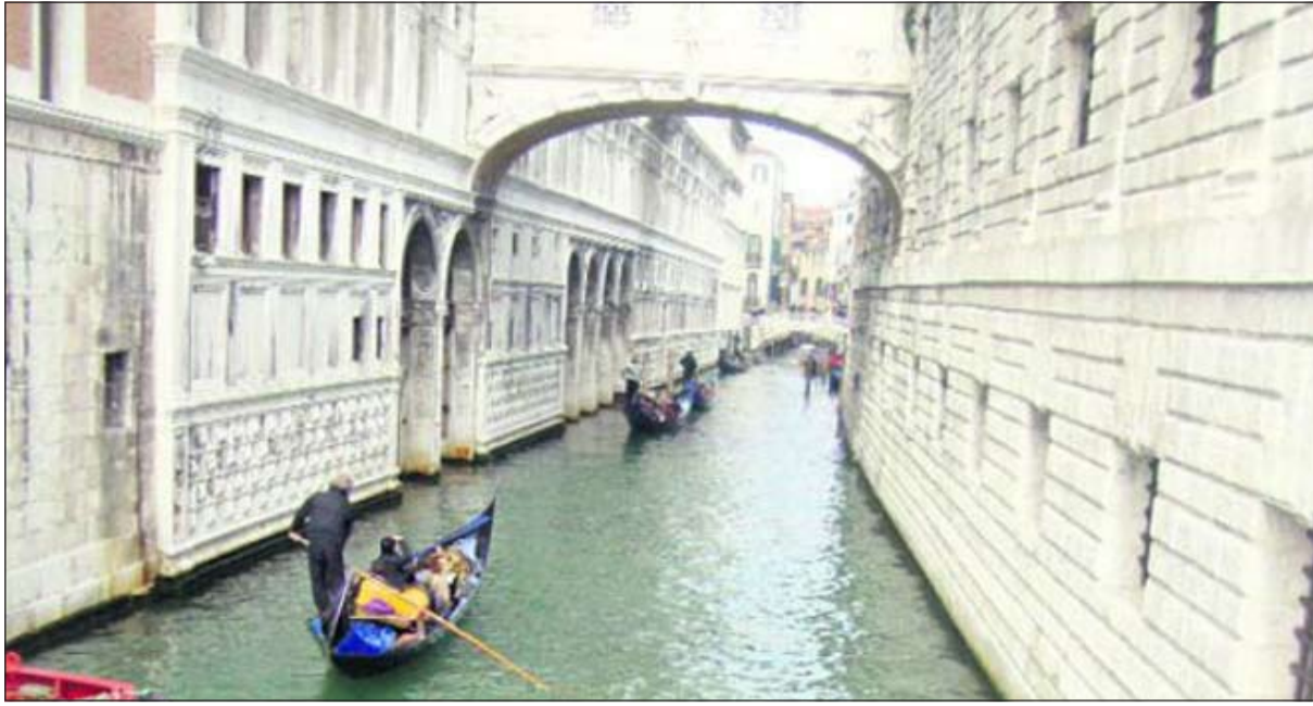
مدينة فينيس بإيطاليا

وقالت كابوسين للمحنة الإذاعية الإخبارية «يمكنك التخلص بشكل أفضل والوقوف بصورة أكثر استقامة ويقل احساسك بالألم الظهر».