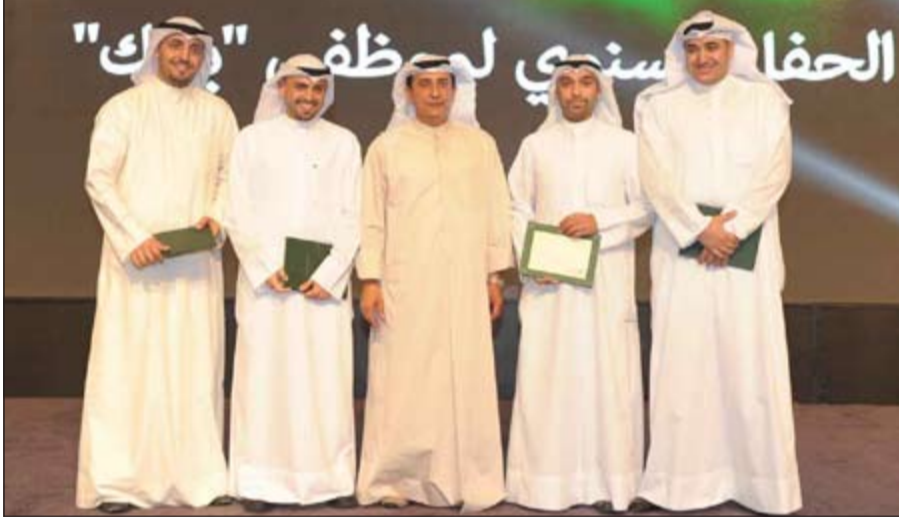
ويتوسط مجموعة أخرى من المتميزين من موظفي البنك في 2012