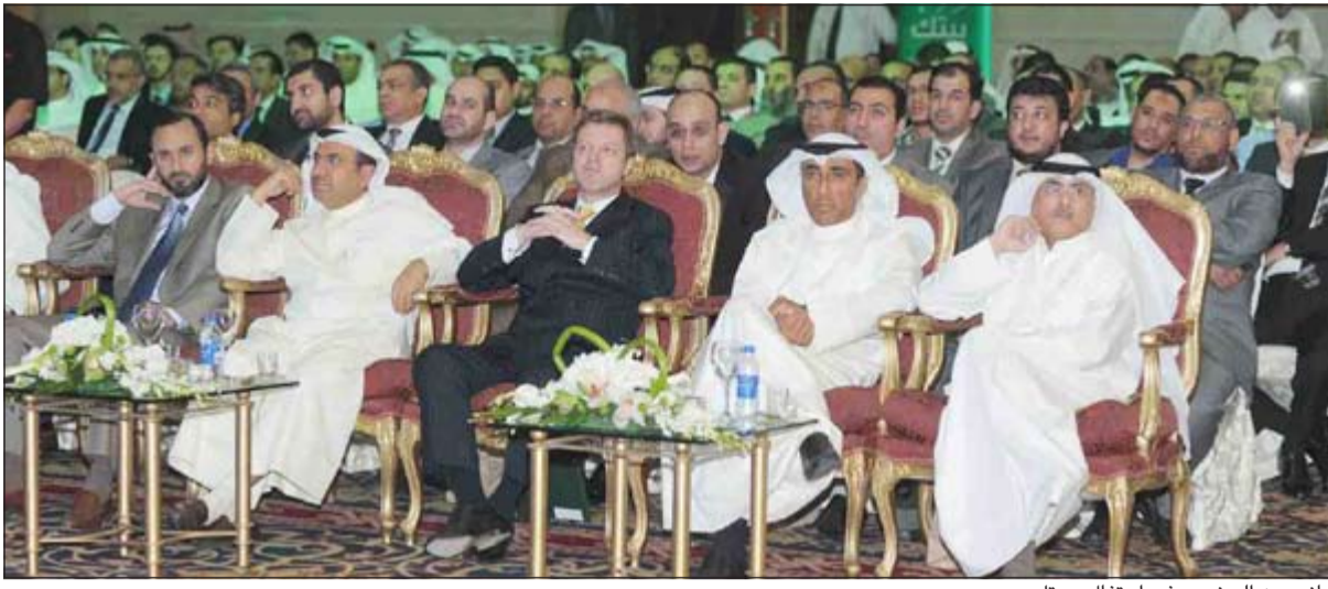
جانب من الحضور في احتفال «بيتك»