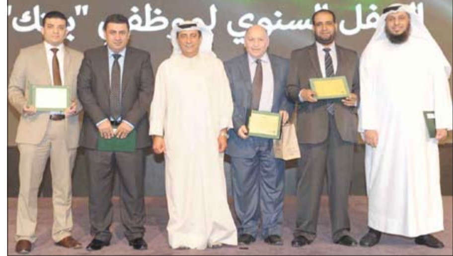
العمر يتوسط مجموعة من المكرمين