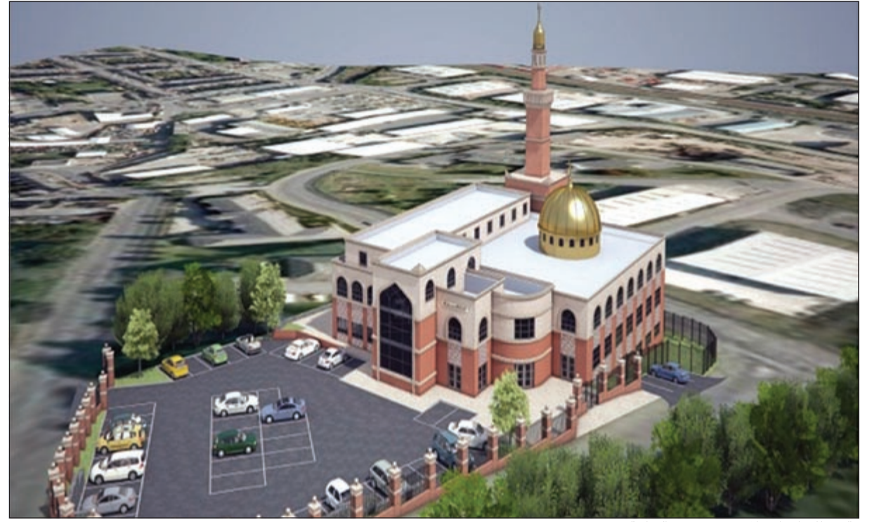
ماكيت للمركز الإسلامي في صورته النهائية

زاروا الكويت بدعوة من «الأوقاف» وأشادوا بدور أهل الخير الكويتيين في دعم المشروع