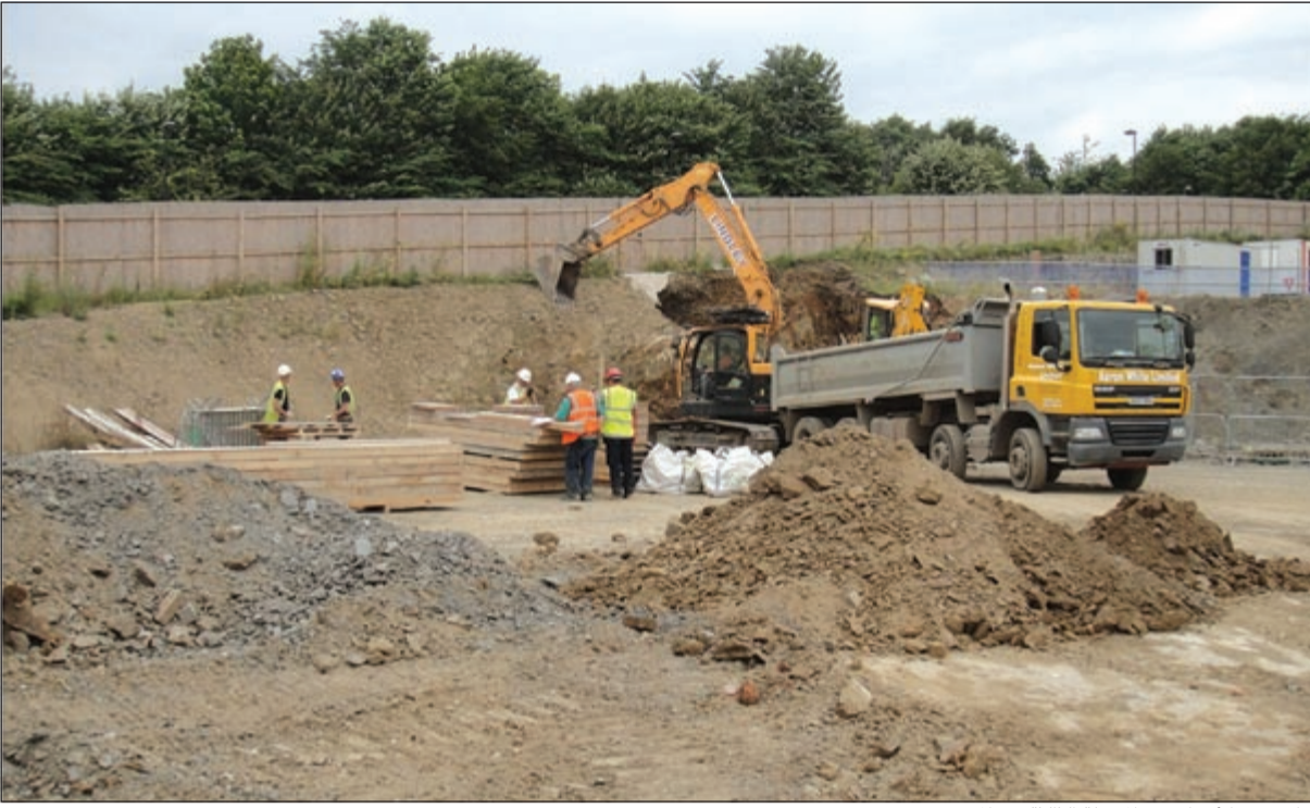
جانب من الأعمال في المرحلة الثالثة من المشروع