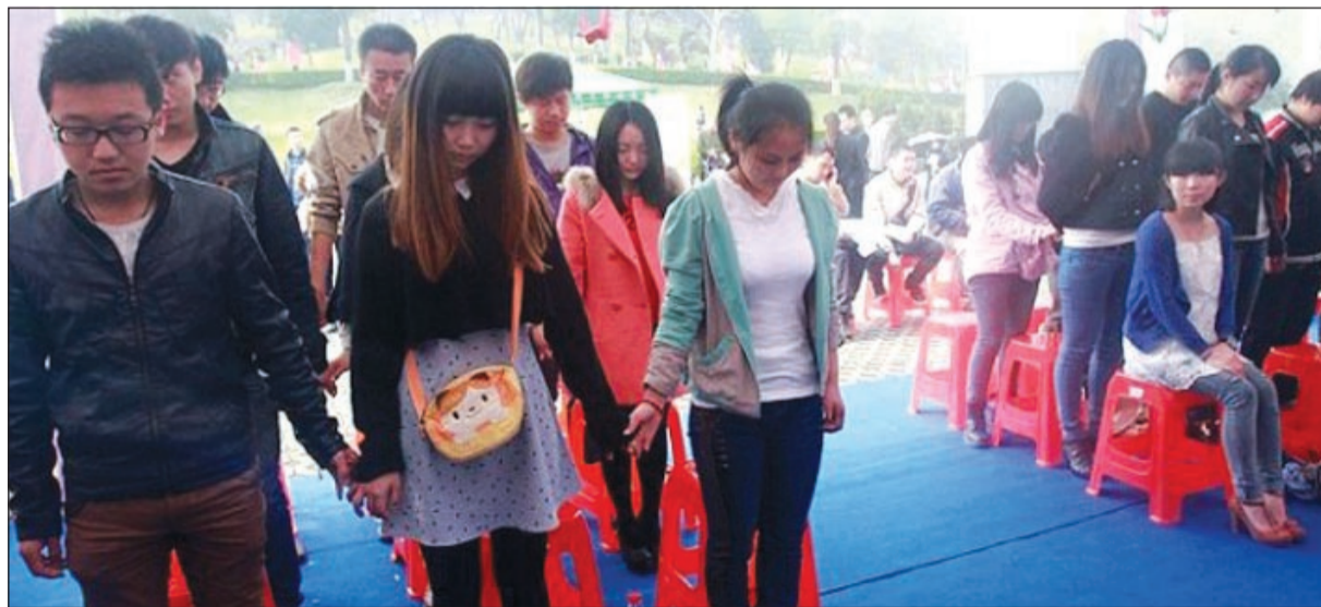
مراسم وهمية لجنازة الفتاة

تأبينها لترى ما هو الشعور الذي يراود المرء وهو جالس في قبره والناس تحيط به والحاضرين. ليس هذا فقط «أوديي سنترال» إن «جيا» قامت بعمل جنازتها بعد شعورها بأن ذلك هو الحفل الشخصي الوحيد الذي لا يستطيع المرء اختيار الشكل