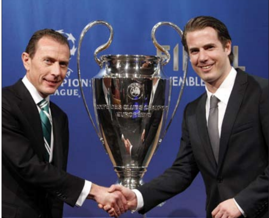
لاعب دورتموند السابق لارس ريكن مع مدير ريال مدريد بوتراغينيو بعد أن وقعت القرعة