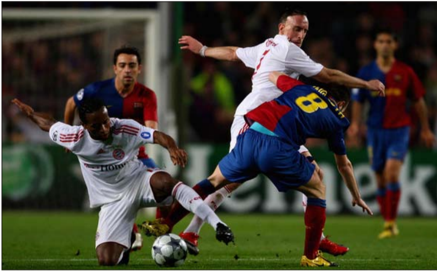
الصراع يتجدد بين بايرن ميونخ وبرشلونة في دوري الأبطال

لعب بطل دوري أبطال أوروبا وخيبته بمواصلته المشوار القاري في الدوري الأوروبي «يوروبا ليغ»، بطوح بازل السويسري، وذلك بعدما أوقعتهم قرعة الدور نصف النهائي التي سحبت في نيون، في مواجهة بعضهما، وستكون هذه المواجهة الأولى بين الفريقين على الإطلاق، أما المواجهة الثانية في دور الأربعة فستعجم بنفيكا البرتغالي، بطل كأس الأندية الأوروبية البطلة مرتين عامي 1961 و1962 والذي تاهل إلى هذا الدور للمرة الثانية في الموسم الثالثة الأخيرة على حساب نيوكاسل الإنجليزي (1-1) إيابا ونهابا، بفترغشه التركي الذي وصل إلى هذه المرحلة للمرة الأولى في تاريخ مشاركته القارية بعد أن تخلص