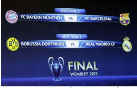
صورة لقرة نصف نهائي دوري الأبطال

أكد مسؤول العلاقات العامة لنادي ريال مدريد الإسباني إيميليو بوتراغينيو أن مواجهة بوروسيا دورتموند الألمانية في الدور قبل النهائي لن تكون سهلة كما يتوقع البعض. والتقى الفريقان في دوري المجموعات، حيث فاز دورتموند على أرضه 2-1، وتعادل الفريقان 2-2 في سانتياغو برنابيو. وقال بوتراغينيو إن جميع الاحتمالات واردة في تلك المواجهة، وأعرب عن إعجابته بمستوى دورتموند، ووصف الفريق الألماني بأنه قوي ويمتلك عقلية خوض المباريات للفوز فقط، وهو ما سيؤدي من صعوبة المواجهة.