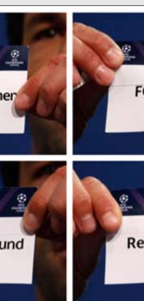
لحظة اعلان نتيجة القرعة في مقر الاتحاد الأوروبي (إ.ق.ب)