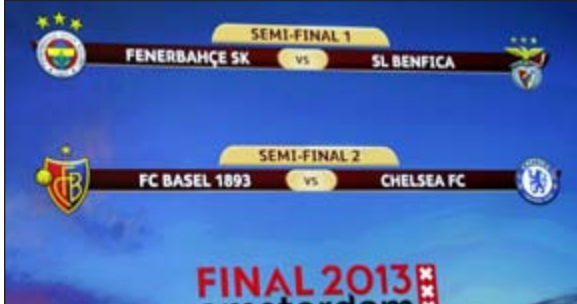
صورة لقرة نصف نهائي «يوروبا ليغ»