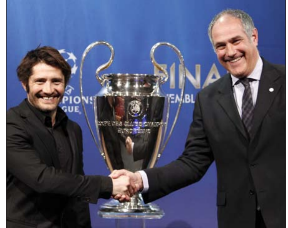
لاعب بايرن ميونخ السابق ليزارازو مع مدير برشلونة زوبيزاريتا