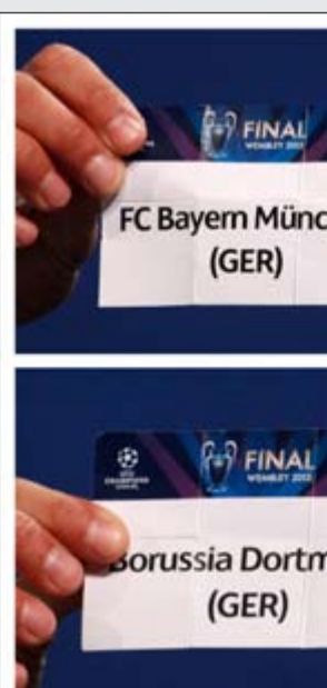
لحظة اعلان نتيجة القرعة في مقر الاتحاد الأوروبي (إ.ق.ب)