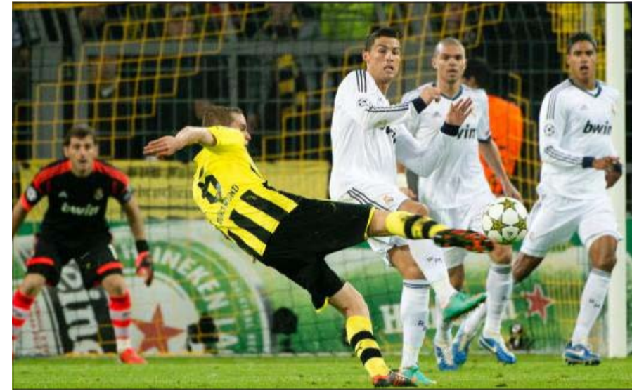
دورتموند فاز على «الملك» في دوري المجموعات في مفاجأة كبرى

في 25 مايو على ملعب ويمبلي في لندن. ريدو أفعال أكد يوب هاينكس المدير الفني لبايرن ميونخ أن مواجهة برشلونة في الدور قبل النهائي ببطولة دوري أبطال أوروبا، تشكل تحديا حقيقيا بالنسبة لفريقه المتوج حديثا بلقب الدوري الألماني (بوندسليغا). ويتطلع هاينكس إلى كتابة نهاية مشرقة لشواره مع بايرن قبل أن يرحل عن الفريق بنهاية الموسم ويحل مكانه المدرب الإسباني الشهير جوسيب غوارديولا، لكن لقاء برشلونة في البطولة الأوروبية يشكل عقبة صعبة أمام الفريق البافاري وهو ما اعترف به هاينكس.