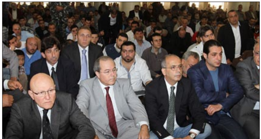
الرئيس المكلف تمام سلام خلال صلاة الجمعة في مسجد المصيطبة أمس

وأعمالهم وسمعتهم، ورابعاً ان تكون قسادة على العمل كفريق متجانس لا متناقض او متناقض.