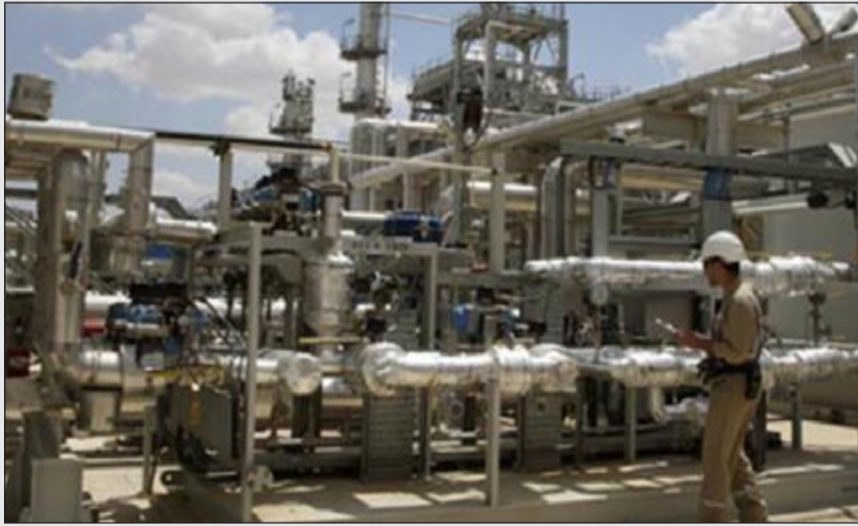
محصول شركات النفط على مستحقاتها قد يستغرق عدة سنوات