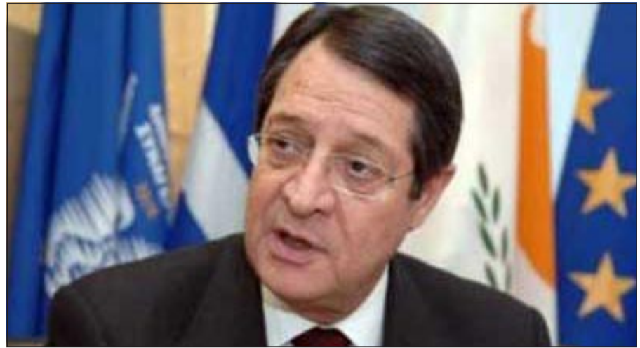
الرئيس القبرصي نيكوس اناستاسياديس

لندن - رويترز: تراجع الأسهم الأوروبية قليلا امس بعد صعود استمر أربعة أيام وقال متعاملون إن السوق تخشى أن تحتاج قبرص مزيدا من المساعدات المالية. وتراجع مؤشر يوروفيرست 300 لاسهم الشركات الأوروبية الكبرى 0,3% إلى 1189,31 نقطة بينما هبط مؤشر يورو ستوكس 50 للأسهم القيادية في منطقة اليورو 0,5% إلى 2660,67 نقطة. واجتمع وزراء مالية الاتحاد الأوروبي امس