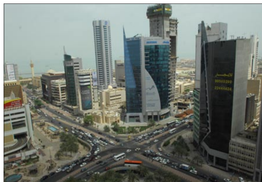
ارتفاع التداول على العقارات الخاصة والتجارية وانخفاض التداول على العقارات الاستثمارية

كشفت إحصاءات إدارتي التسجيل العقاري والتوثيق في وزارة العدل خلال الفترة من 10 إلى 14 مارس الماضي عن 18 صفقة مليونية بقيمة 36,6 مليون دينار ركزت جميعها في العقود المسجلة لصفقات البيع التي تمت خلال هذه الفترة. وكانت هذه الصفقات عبارة عن 9 صفقات تمت في العقار الاستثماري فقد كانت صفقات تمت في العقار الخاص و4 عقارات تمت في العقار التجاري، أما الـ 9 صفقات التي تمت في العقار الاستثماري فقد كانت عبارة عن بناية مساحتها 908 أمتار بقيمة 1,02 مليون دينار وبناية مساحتها 1140 متراً بقيمة 1,6 مليون دينار وبناية مساحتها 786 متراً بقيمة 1,1 مليون دينار وبناية مساحتها