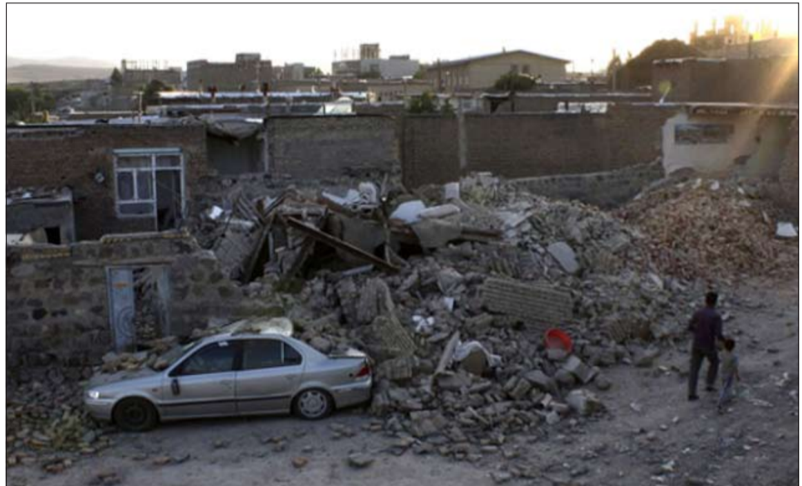
زلزال إيران شكل هاجساً كبيراً لدول «التعاون» بسبب المخاوف من حدوث تسرب إشعاعي من مفاعل بوشهر

الرياض - أ.ش.: في تحرك سريع، تقرر أن تعقد الدول الخليجية أعضاء مجلس التعاون الست اجتماعاً طارئاً غداً في الرياض «لبحث إمكاناتها في التصدي لأي كارثة بيئية محتملة قد تنشأ من أي تسرب إشعاعي من مفاعل بوشهر النووي، وخاصة بعد الزلزال الذي ضرب جنوب غرب إيران». وصرحت مصادر دبلوماسية رفيعة لمصادر «الوطن» السعودية أمس بأن الاجتماع سيبحث خطط الطوارئ الوطنية لدى دول المجلس، وأن مفاعل بوشهر النووي يشكل هاجساً كبيراً، لما يمثله من تهديد مباشر على دول الخليج العربي. ولم تخف المصادر مخاوف دول مجلس التعاون الخليجي من تآثر