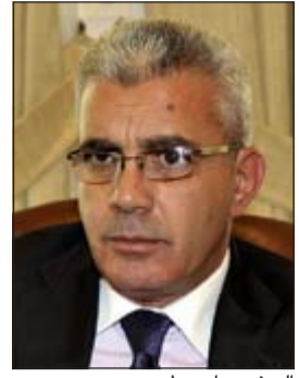
السفير رامزي طهبوب

أشاد سفير فلسطين لدى الكويت رامزي طهبوب بالدور الذي أدته الكويت في تأسيس الثورة الفلسطينية وانطلاقها من أراضيها، معرباً عن التقدير الكبير للدعم والتأييد اللذين قدمتهما للقضية الفلسطينية خلال العقود الماضية. جاء ذلك في لقاء للسفير طهبوب مع «كونا» بمناسبة الزيارة الرسمية التي سيقوم بها الرئيس الفلسطيني محمود عباس إلى الكويت الأسبوع المقبل والتي من المقرر أن يفتتح خلالها سفارة دولة فلسطين لدى الكويت. وقال السفير طهبوب إنه لا أحد ينسى دور الكويت في تأسيس وانطلاق الثورة الفلسطينية من على أراضيها وسماحتها للسلطة الفلسطينية بممارسة عملها السياسي الذي لولاها لما وصلنا إلى ما وصلنا إليه اليوم، معرباً عن شكره لمواقف الكويت الداعمة لفلسطين على كل الأصعدة. وأضاف أن العلاقة المميزة والقوية جداً على المستوى الدبلوماسي والشخصي بين الرئيس الفلسطيني محمود عباس