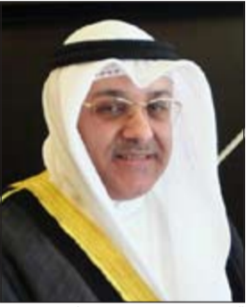
السفير سمح جوهر حيات

من السفير حيات نيابة عن حكومة الكويت ووزير الاقتصاد الديفونسو غوخاردو فياريال نيابة عن حكومة المكسيك. وأضاف أن أهم أهداف الاتفاقية هو اجتذاب الشركات الكويتية والكويتية للاستثمار في كلا البلدين وفي كل المجالات القطاعين العام والخاص في المكسيك والكويت، إضافة إلى تقديم الضمانات اللازمة لتلك الشركات وحماية استثماراتها الجانبين. وقال إن الهدف الأهم بعد التوقيع هو تفعيلها على أرض الواقع والعمل بها حتى يتمكن الجانبان من النهوض بالعلاقات الاستثمارية والتجارية لتكون في مستوى العلاقات السياسية المميزة بين البلدين. وشدد السفير حيات على أن توقيع الاتفاقية وتفعيلها بهذه السرعة يدل على الاهتمام الكبير الذي توليه وترعاه قيادتنا البلدين وهو خطوة مهمة في تطوير العلاقات الاقتصادية والاستثمارية والتجارية بين البلدين.