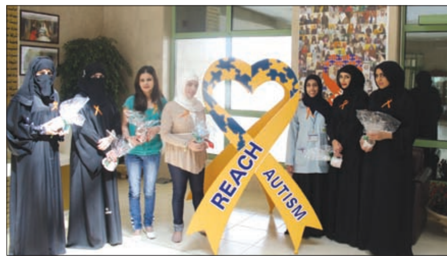
الطلاب المشاركات في الدورة التدريبية

انطلاقا من أهمية العمل الميداني في دفع عملية التنمية الوطنية إلى الأمام قامت الهيئة العامة للتعليم التطبيقي ولأول مرة بالتعاون مع مركز الكويت للتوحد لتدريب عدد من الطالبات بدورة حول العمل الإداري والتي استمرت شهرين واجتازتها الطالبات بمهارة كبيرة حيث تم تكريمهن وتوزيع الشهادات عليهن، الأمر الذي يفتح مجال التدريب الميداني بين مركز الكويت للتوحد والهيئة العامة للتعليم التطبيقي، بعد تعاون سابق مع جامعة الكويت.