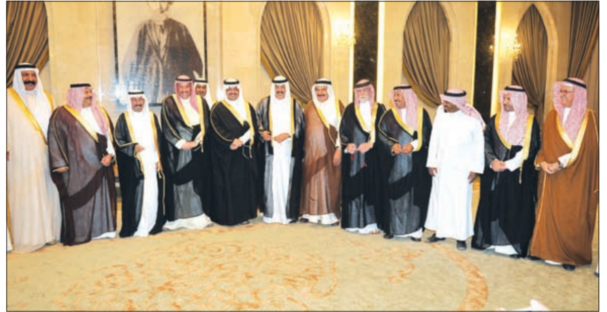
الأمير تركي بن طلال بن عبدالعزيز والشيخ فيصل الملك وسلطان بن حثلين يتوسطون عددا من الحضور في ديوان آل حثلين