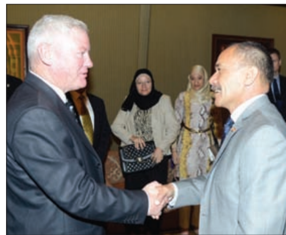
حاكم عام نيوزيلندا مستقبلا أبناء الجالية النيوزيلندية