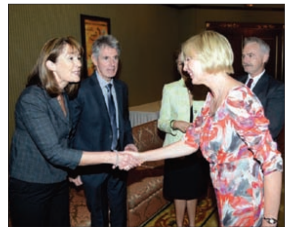
جانب من حفل استقبال الجالية النيوزيلندية

وحرمه صباح أمس الجالية النيوزيلندية المقيمة بالكويت قصر بيان.