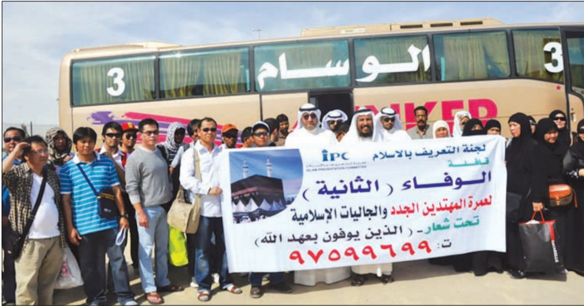
انطلاق قافلة الوقفاء الثانية للعمرة

تُزور ملكة السويد ورئيسة مؤسسة منقور العالمية الملكة سيلفيا «لويك» لإقامة مؤتمر صحافي ولقاء عدد من الطلبة والشباب بحضور الأمير تركي بن طلال ووزير الإعلام الشيخ سلمان الحمود ووزير التربية د. نايف الحجرف وعدد من الشخصيات، وذلك في الساعة 11:30 من صباح اليوم السبت في مقر لويك - المدرسة القبلية - شارع علي السالم.