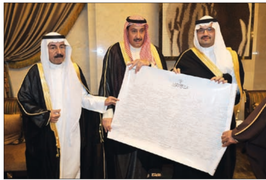
هدية تذكارية مقدمة للأمير تركي بن طلال بمناسبة زيارته ديوان آل حثلين

قام صاحب السمو الملكي الأمير تركي بن طلال بن عبدالعزيز بزيارة ديوان أمير قبيلة العجمان الشيخ سلطان سلمان بن حثلين مساء أمس الأول بمنطقة العقيلة. وقال الأمير تركي ردا على سؤال أحد الصحافيين عن سبب الزيارة: عندما تزور أخاك وأطيب الناس لا يحتاج إلى سبب لهذه الزيارة. مضيفا: أخبرني الشيخ فيصل الملك أن هذا الديوان جديد والسيرة العطرة لهذه الأسرة وهذه القبيلة لا تحتاج إلى ديوان.