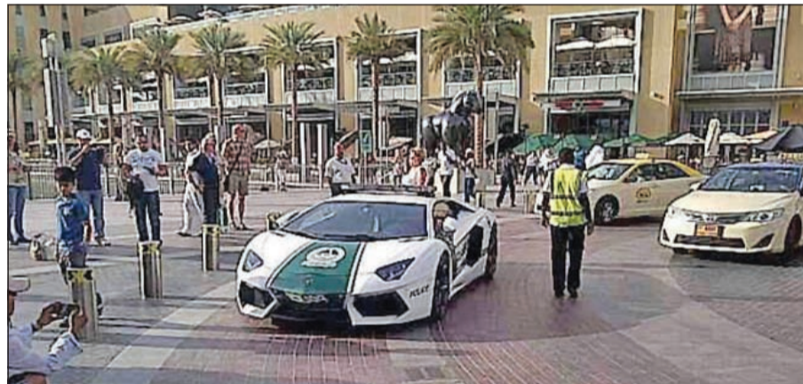
دورية لامبورغيني أمام أحد أسواق دبي

العالم، وأكد اللواء خميس مطر المزينة، أنها تعبر عن القيمة المعنوية والأدبية لشرطة دبي وتعطي لزيوار الإمارة انطباعا حقيقيا عن حجم دبي ودرجة رقيها. وكانت شرطة دبي، طرحت أخيرا نماذج من دورياتها الجديدة على أفراد المجتمع من مواطنين ومقيمين من خلال مواقع التواصل الاجتماعي، إضافة إلى موقع شرطة دبي لاستطلاع آرائهم، وتلقي ملاحظاتهم عليها.