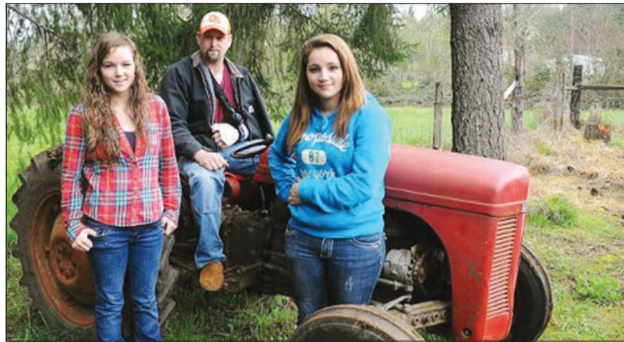
المراهقتان الخارقتان والدتهما

وقد سقط على صدره الجرار الزراعي ويغطيه الوحد. وحاولت الأختان في البداية الحفر ليتمكن والدهما من الانزلاق إلى الخارج وحين فشلنا بذلك، حاولتا رفع الجرار.