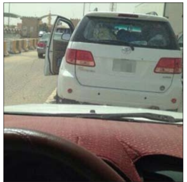
المركبات اصطفت مقابل منافذ الكويت البرية

أدى عطل نظام الإدخال في أجهزة الحاسب الآلي بمنفذي السالمي والنويصيب الحدوديين إلى ازحام شديد واجهه المسافرون للمملكة العربية السعودية، حيث استمر لأكثر من ست ساعات.