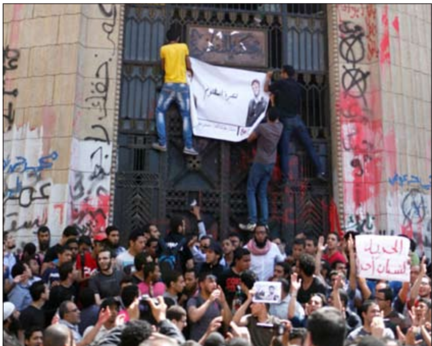
نشطاء سياسيون يطالبون بالإفراج عن زملائهم المعتقلين امام «القضاء العالي» أمس