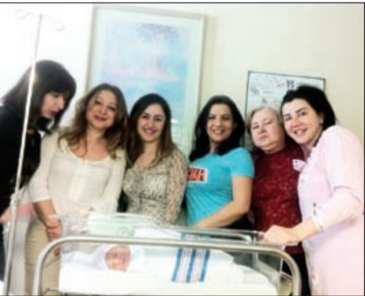
جينى إسبر مع ابنتها وعدد من أصدقائها بعد ولادتها

بعد أيام على ولادتها، ابنتها، كشفت الممثلة السورية جينى إسبر عن صورة ابنتها الأولى «ساندي» التي أنجبتها في إحدى مستشفيات مناهن - الولايات المتحدة الأميركية. ونشرت اسبر الصور على صفحتها الخاصة على موقع «تويتر» وعلقت عليها: «ساندي تقول لكم مساء الخير». يشار الى ان جينى متزوجة من المنتج عماد ضحيفة منذ خمس سنوات.