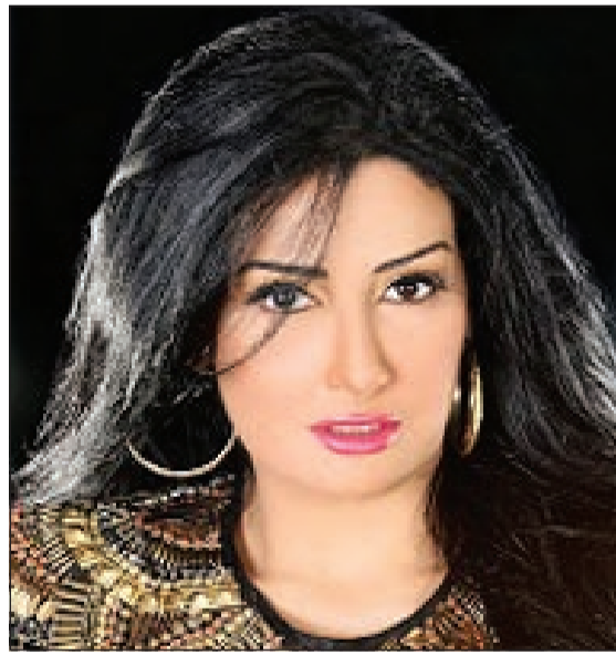
غادة عبد الرازق

وكان ذلك في بداية المشروع، وقال إنه لا يعلم إلى أين ستسير الأمور بعد ذلك،