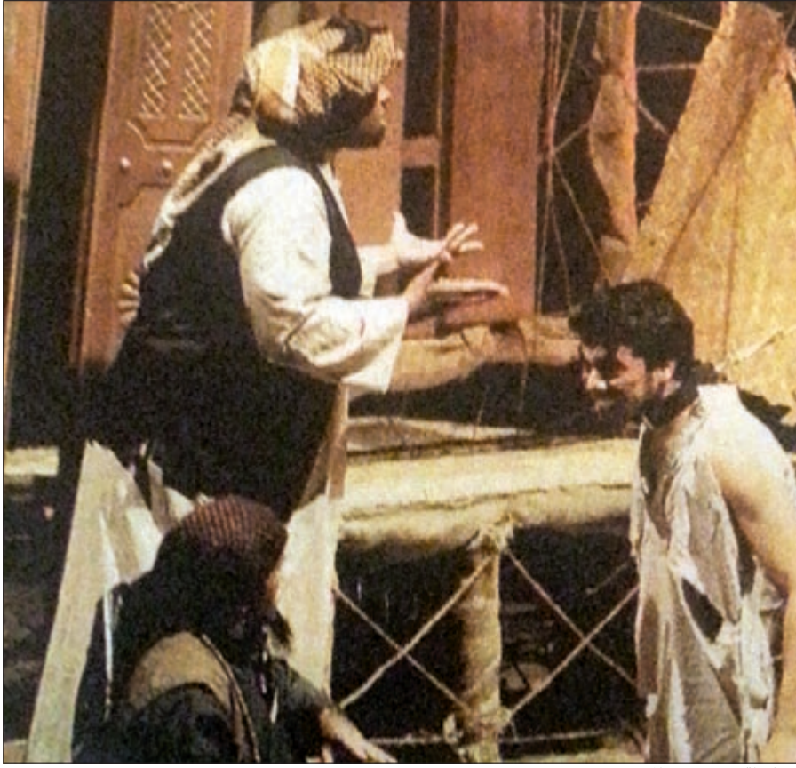
.. ولقطة من عرض «المسعود»