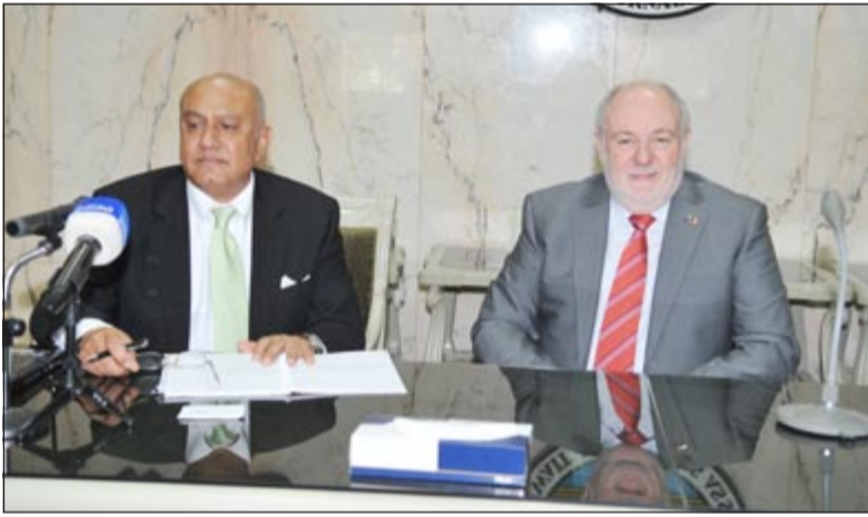
السفير الأسترالي روبرت تايسون والحامي فوزي سليمان (سعود سالم)

والطلبة كذلك. واعتبر سليمان ان الكويت بحاجة الى تقديم المشورة القانونية فيما يتعلق بهجرة الاستثمار، موضحا ان أستراليا لم تغلق ابواب الهجرة منذ 30 عاما ولكن الظروف تتغير بسبب للتغيرات السكانية، موضحا ان آلية القائمة تمتد الى 18 شهرا وفق ضوابط الهجرة الأسترالية.