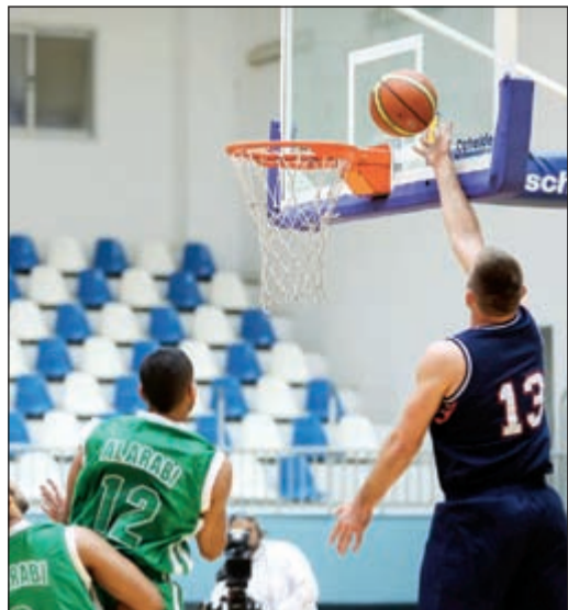
لاعب العربي والبرموك سيتسابقون على تسجيل النقاط في مواجهتهما الصعبة اليوم (عادل يعقوب)

الاولى لهم معا في دوري أبطال الخليج ولن تتوقف مشاركتهم عند هذا ويستواجدون فيما تبقى من مباريات الدوري وكذلك كأس سمو الأمير والباب مفتوح لاكثر من لاعب شاب. وأكد نصار ان تحقيق الفوز والانتصارات في مباراتي السدوري المقبلين مرهون باللاعبين ومدى تطور مستواهم، مشيرين إلى ان البرتغالي مطالب بتحقيق الفوز على الجهاد والعربي لكي يضمن البقاء في الدوري الممتاز بصورة كبيرة وهو أمر ليس بمستحيل على فريق