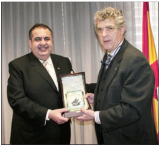
السير عادل العيار يقدم درعا تذكارية لرئيس الاتحاد الإسباني لكرة القدم انخل ماريا بيار