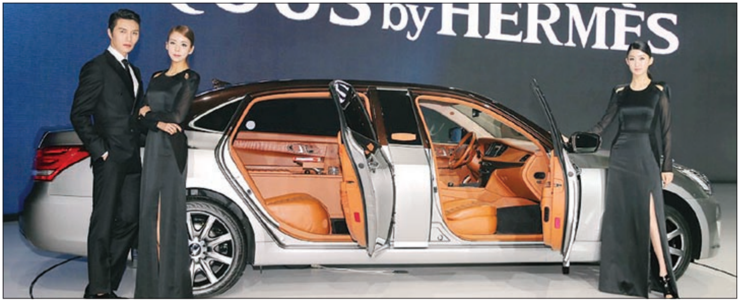
هيونداي سينتينيال النسخة المعدلة التجريبية

وعن الـ «لايكن» صرح المدير التنفيذي لدبليو موتورز رالف دياس قائلاً: «نحن نصنع التاريخ بأول سيارة عربية ذات سرعة فائقة، وهي تعد السيارة الأكثر تميزاً في العالم». وأضاف: «نحن فخورون بدعم سمو الشيخ ناصر المحمد ومتحف السيارات التاريخية والقديمة التقليدية في الكويت لاهتمامهم بهذا الإنجاز العربي في عالم السيارات. ونحن فخورون بالتعاون مع المتحف على هذا الحدث المثير الذي لا ينسى متمنين التعاون مجدداً في العديد من الأنشطة مستقبلاً. تم إطلاق شركة دبليو موتورز في يوليو 2012 في حفل التعريف الذي أقيم بقصر «سرسق» في بيروت، حيث أعلن مؤسس الشركة «رالف