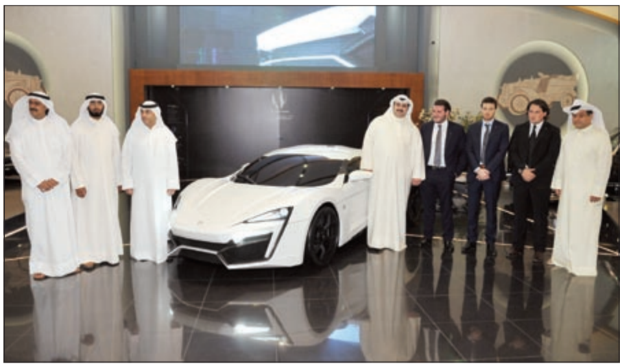
لقطة جماعية مع السيارة

دياس» للعالم عن السيارة الأكثر تميزاً للحضور الشغوف. وقد تمثل هذا الإعلان في ولادة سيارة «لايكن» العربية ذات السرعة الفائقة، التي تم عرضها رسمياً للعالم في 28 يناير 2012 في معرض قطر الدولي للسيارات وبحضور وسائل الإعلام الإقليمية والعالمية، حيث حضر أكثر من 150 ألف زائر للمعرض لمشاهدة هذه السيارة العربية الأولى من نوعها في قسم دبليو موتورز في المعرض.