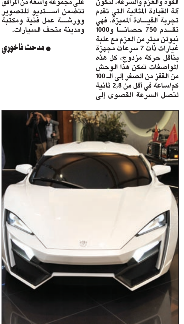
سيارة «لايكن» أول سيارة عربية فائقة السرعة

رعى متحف السيارات التاريخية والقديمة والتقليدية حفل استضافة أول سيارة عربية فائقة السرعة «لايكن» وهي مصنعة من قبل شركة «دبليو موتورز» العربية. حيث ستعرض السيارة لمدة أسبوع في قاعة العرض الرئيسية في المتحف من 9 وحتى 16 الجاري.