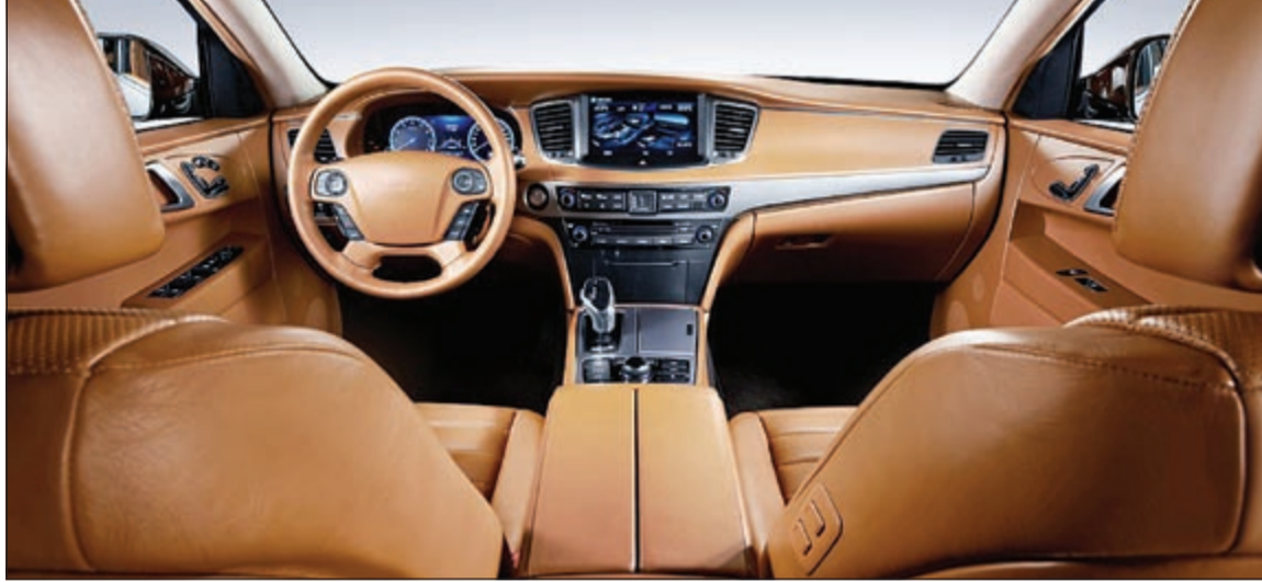
مقصورة هيونداي سينتينيال التجريبية من الداخل

تتميز مميز للسيارة، حيث يتمكن العميل عند اقتناء أحدث الموديلات من السيارات الفاخرة من هيونداي أن يعيد تميز سيارته لدى شركة شمال الخليج التجارية، مما يسهل الأمر للعملاء الذين يرغبون في تغيير سياراتهم بشكل مستمر وامتلاك الطرازات الفاخرة الجديدة من هيونداي.