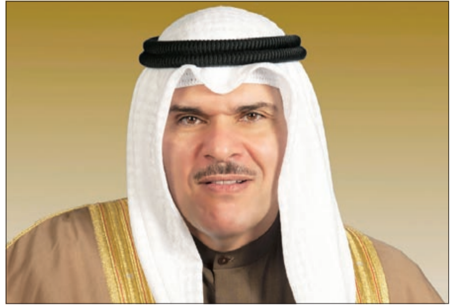
الشيخ سلمان الحمود

ينتظر العاملون في القناة الثالثة «قناة الشباب والرياضة» قرارات سيصدرها وزير الإعلام ووزير الدولة لشؤون الشباب الشيخ سلمان الحمود مطلع الأسبوع المقبل تشمل جميع إدارات القناة الثالثة وذلك لتطوير أدائها الذي يشهد في الفترة الحالية نوعاً من الإخفاق حتى تنافس القنوات الرياضية الحالية. وتكشفت مصادر لـ «الأنباء» أن القرارات تعتبر بمنزلة «غربة» كاملة للقناة لتحقيق الهدف التي أنشئت من أجله وتكون برامجه