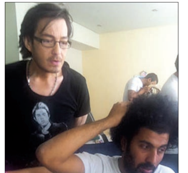
أحمد زاهر في كواليس مسلسل «حكاية حياة»

وتدخل زاهر على الفور ويرر ظهوره بهذا الشكل قائلاً، بحسب ما ذكر موقع «جولولي»: «يا جماعة أولاً شكراً لكم وثانياً أنا مش عيان ولا حاجة أنا خست علشان دوري في مسلسل «حكاية حياة» ادعوا لنا نعمل عملاً جامداً ومحترماً».