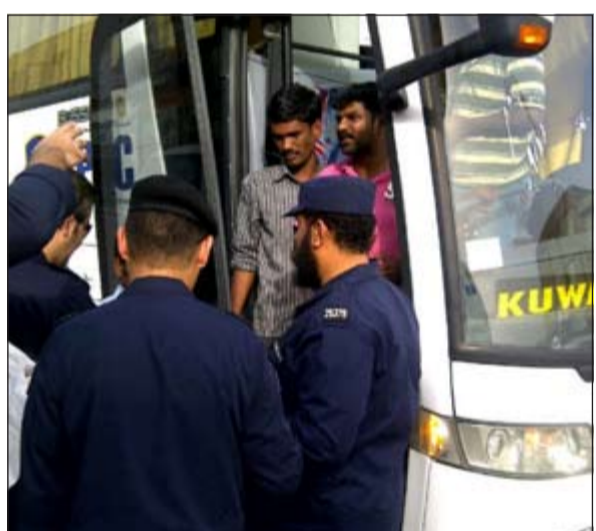
باصات النقل العام شملت حملة «الداخلية»

حيث تمكنت من ضبط عدد من مخالفي الإقامة (بدون إقامة، ومن يعمل لدى الغير، وعمالة سائبة بالإضافة إلى خدم منازل مادة «20») فضلاً عن ضبط أشخاص مطلوبين على ذمة قضايا تمت إحالتهم إلى جهة الاختصاص، وأسفرت الحملة عن ضبط 242 ما بين عمالة سائبة وخدم مادة 20 ووافدين يعملون لدى الغير إلى جانب مطلوبين.