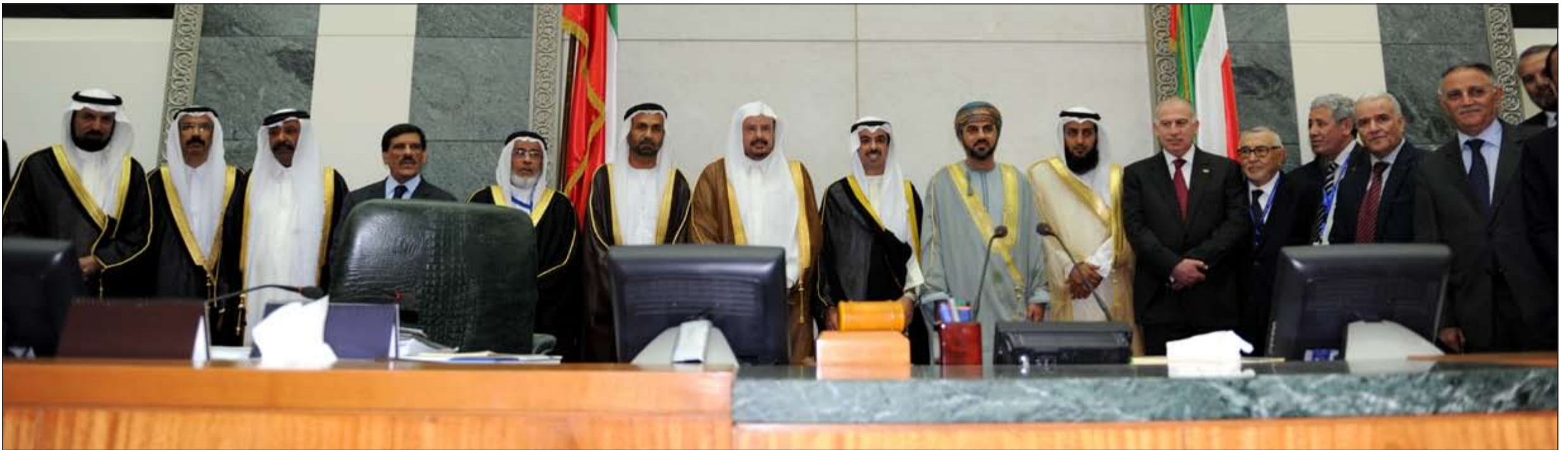
رئيس مجلس الأمة علي الراشد متوسلاً رؤساء الوفود البرلمانية المشاركة في مؤتمر الاتحاد البرلماني العربي في قاعة عبدالله السالم امس الأول

دعا البرلمانات العربية إلى سن التشريعات لتحقيق سيادة القانون والعدالة وإقرار أهداف الشعوب العربية في بناء دول حديثة