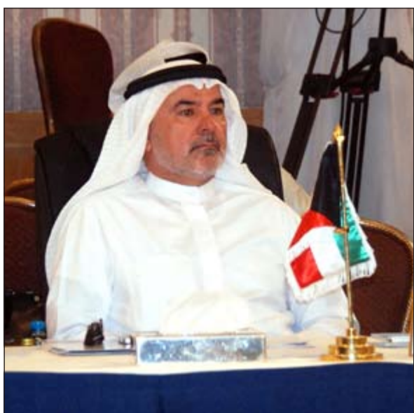
صالح عاشور خلال اجتماع اللجنة السياسية في مؤتمر الاتحاد البرلماني العربي

5 - يدعو إلى تفعيل المبادرات العربية وتمويل الصناديق واتخاذ مواقف حازمة ضد سياسات المحتلين الصهيونية والأحلالية ومن يساند تلك السياسات ويدعمها من قوى دولية ومنظمات. 6 - يشدد على أن قضية الأسرى والموقوفين تأخذ بعداً سياسياً وإنسانياً خاصاً أنها بحاجة إلى مزيد من التواصل مع القوى المؤثرة والمنظمات الدولية ذات الصلة لضمان سلامتهم واطلاق سراحهم، فلا يزال هناك أكثر من أربعة آلاف أسير وموقوف فلسطيني في سجون الاحتلال بمن فيهم العديد من البرلمانيين المنتخبين والأطفال والنساء. 7 - يؤكد على حق الشعب الفلسطيني في العودة والتعويض وفقاً لقرار الأمم المتحدة رقم 194. 8 - يحيي صمود الشعب الفلسطيني الذي قدم ويقدم التضحيات منقطعة النظير واستخدامه ويستخدم حقه في المفاوضات من دون شروط