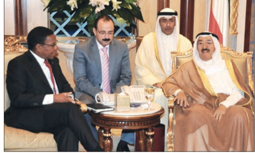
صاحب السمو الأمير خلال لقائه وزير خارجية تنزانيا

مؤكد في الوقت ذاته أن تلك الرعاية السامية التي لها دور بارز في نجاحه أسمى آيات الشكر والعرفان على الرعاية السامية التي أولاهها سموه للمؤتمر،