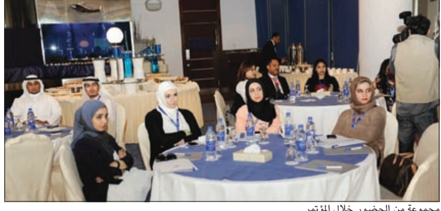
مجموعة من الحضور خلال المؤتمر