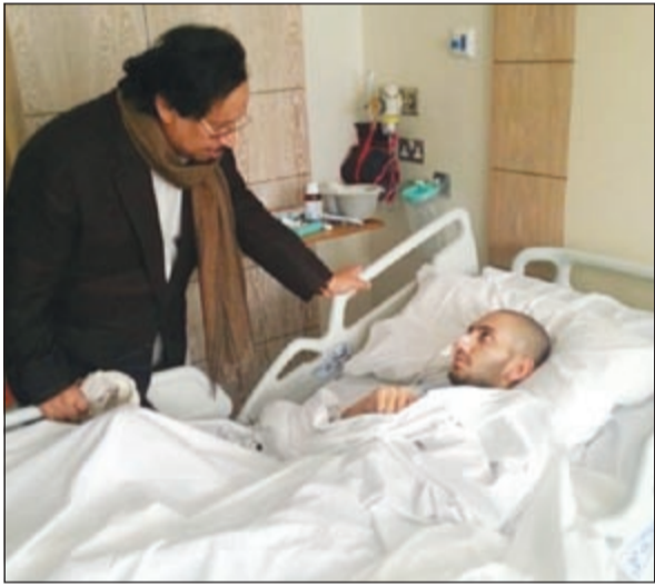
سمو رئيس الوزراء الشيخ جابر المبارك يطمئن على أحد المرضى

زار سمو رئيس مجلس الوزراء الشيخ جابر المبارك خلال تواجده في العاصمة البريطانية أمس عدداً من المرضى الكويتيين الذين يتلقون علاجهم في المستشفيات البريطانية، واطمأن سموه على أحوالهم الصحية، متمنياً لهم الشفاء بإذن الله والعودة إلى أهلهم وذويهم سالمين. كما زار سموه عدداً من العسكريين من كتيبة المغاوير الذين يواصلون علاجهم إثر تعرضهم لحادث في معسكر الأديرع، وأعرب سموه عن تمنياته لهم بالشفاء والعودة إلى أرض الوطن.