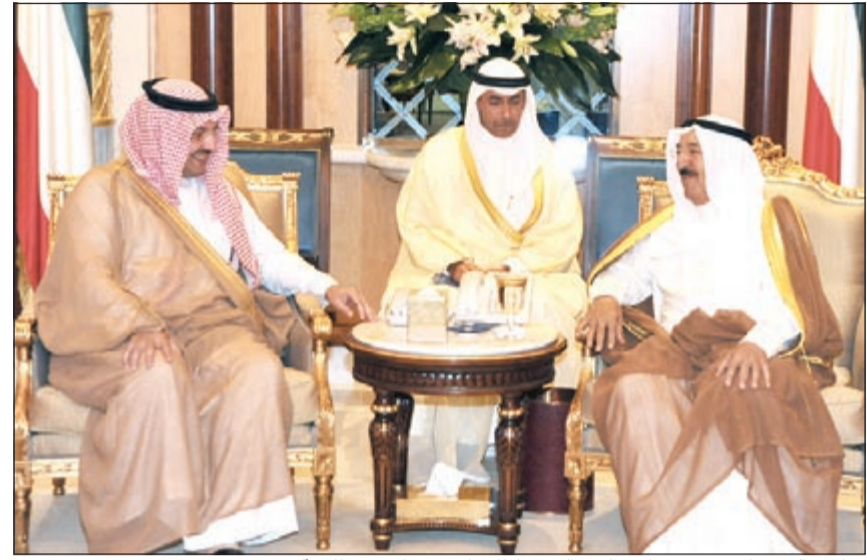
صاحب السمو الأمير مستقبلاً صاحب السمو الملكي الأمير تركي بن طلال آل سعود

ومجسدة اهتمام سموه رعاه الله في توفير كل ما يلزم لتطوير مجال التعليم الإلكتروني، متمنين لسموه رعاه الله موفور الصحة والعافية ولدولة الكويت كل الرفعة والأزدهار في ظل القيادة الحكيمة لسموه. كما بعث صاحب السمو الأمير الشيخ صباح الأحمد ببرقية تعزية إلى الرئيس محمود أحمددي نجاد - رئيس الجمهورية الإسلامية الإيرانية الصديقة عبر فيها سموه عن خالص تعازيه وصادق مواساته بضحايا الزلزال الذي تعرضت له عدة قرى جنوب إيران والذي أسفر عن سقوط العديد من الضحايا والمصابين، سائلاً سموه المولى تعالَى أن يتغمّد الضحايا بواسع رحمته وأن يمن على المصابين بسرعة الشفاء والعافية، وبأن يتمكن المسؤولون في البلد الصديق من تجاوز آثار هذه الكارثة الطبيعية. وبعث سمو ولي العهد الشيخ نواف الأحمد ببرقية تعزية إلى الرئيس محمود أحمددي نجاد - رئيس الجمهورية الإسلامية الإيرانية الصديقة عبر فيها سموه عن خالص تعازيه وصادق مواساته بضحايا الزلزال الذي تعرضت له عدة قرى جنوب إيران، كما بعث سمو الشيخ جابر المبارك رئيس مجلس الوزراء ببرقية تعزية مماثلة.