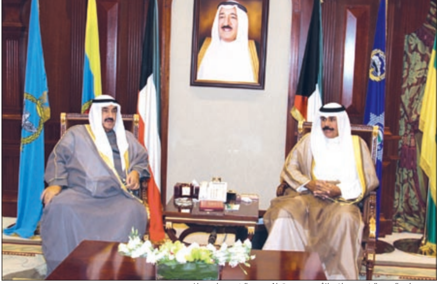
سمو ولي العهد الشيخ نواف الأحمد مستقبلاً سمو الشيخ ناصر المحمد

استقبل سمو ولي العهد الشيخ نواف الأحمد بقصر بيان صباح أمس رئيس مجلس الأمة السابق جاسم الخرافي. واستقبل سموه بقصر بيان صباح أمس سمو الشيخ ناصر المحمد. كما استقبل سمو ولي العهد بقصر بيان رئيس مجلس الوزراء بالإتابة ووزير الداخلية الشيخ أحمد الحمود.