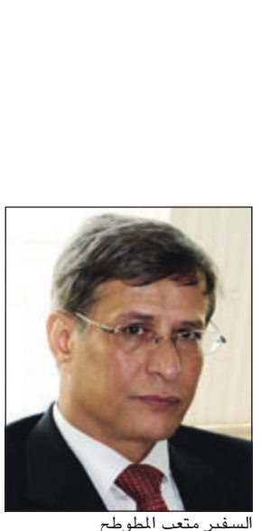
السفير متعب المطوطح

طوكيو - كونا: افتتح سفيرا لدى كوريا الجنوبية متعب المطوطح الجناح الكويتي في معرض «زيئات من دول العالم» وديكورات من دول العالم، الذي يهدف إلى تعزيز التراث والثقافة في جميع أنحاء العالم. وقالت سفارتنا لدى كوريا الجنوبية في تصريح متعب المطوطح الجناح الكويتي «كونا» أن التراث الكويتي يجذب الزوار في هذا المعرض الفريد من نوعه حيث يشهد جناح الكويت اقبالاً كبيراً من قبل الزوار الأجانب بهدف التعرف على الثقافة الكويتية الأصيلة. وتضمنت زوجات السفراء في كوريا الجنوبية تحت رعاية المركز الثقافي الكوري المعرض الذي يعكس الثقافة والحضارة في جميع دول العالم مثل مائدة الإفطار خلال شهر رمضان المبارك للبلدان الإسلامية والأطعمة التي يتم تقديمها في عيد الشكر لدى الولايات المتحدة واحتفالية «ديبأفالي» في الهند. وسلط الجناح الكويتي الضوء كذلك على حفلات وفساتين الزفاف التقليدية باستخدام الذهب والتطريز. ويشترك في هذا الحدث الذي يستمر حتى الـ 13 من إبريل الجاري 28 بلداً من ضمنها الجزائر ومصر والمغرب وعمان وتونس والولايات المتحدة.