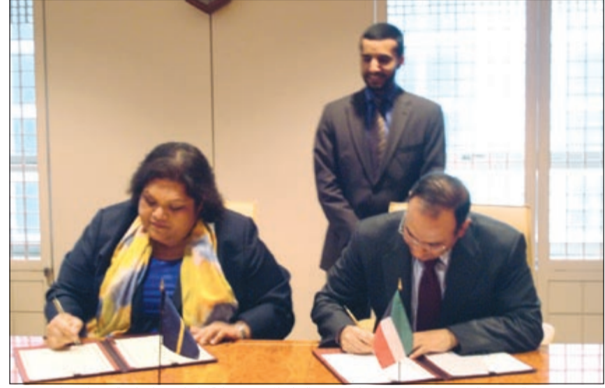
السفير منصور العتيبي والسفيرة مارلين موزس خلال توقيع البيان المشترك لإقامة علاقات دبلوماسية بين بلديهما

هناك دولة واحدة قادرة على حل تلك المشاكل بفردها ومن ثم فهناك حاجة إلى تضافر جهود المجتمع الدولي لمواجهة تلك القضايا». وأشار إلى وجود أوجه تشابه بين الكويت وناورو في عدد من الأمور وإمكانية التعاون بين البلدين في