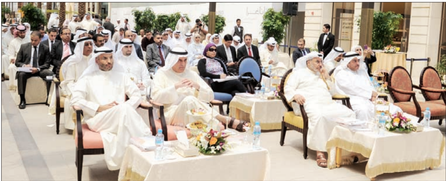
حضور كثيف لمتابعة جدول أعمال عمومية «المباني»

لأفنا إلى ان الأقنيوز يعتبر نموذجا ناجحا ومحفزا على تشجيع السياحة الداخلية، إذ استقطب عددا كبيرا من الزوار من الكويت وخارجها منذ افتتاحه، مما يعني أن الكويت يمكن أن تكون منطقة جذب سياحي لسياح من منطقة الخليج والوطن العربي من خلال مشروعات ناجحة تضع الكويت ضمن خريطة السياحة العربية. وتابع قائلا: لاتزال ردود الفعل الإيجابية تتوالى من قبل وسائل الإعلام والزوار حول تميز المناطق الجديدة