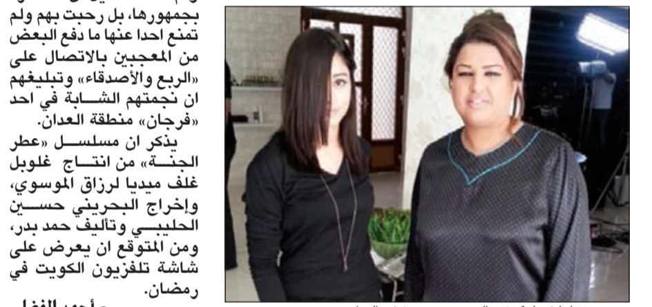
.. وصوره لها في لوكيشن التصوير بمستشفى العدان

رأت الفنانة اليمنية أروى أن الساحة الغنائية في الوقت الحالي حالها مخيف، مشيرة إلى أنه تم طرح البومات غنائية لنجوم كبار في الآونة الأخيرة ولم يحققوا نجاحاً وهذا يجعلها محبطة. وقالت أروى: هذه الأعمال بالتأكيد تم فيها بذل مجهود، فشيء مؤسف ألا تلقى نجاحاً، لكن الظروف الآن لدى الجمهور لا تسمح لهم بتقبل ما يحدث نظراً للأحداث الراهنة، لكني أنا على المستوى الشخصي لم أتغير وما كنت أقدمه قبل الثورات ساظل أقدمه، وأنا لدي خط فني منذ بداياتي حيث إنني لا أسعى وراء الشهرة، ولا أسعى إلى أي شيء كما يفعل البعض من اللهث وراء الأضواء. وأضافت أروى في مقابلة لها مع صحيفة «الشرق الأوسط»: بلا منازع أنا نجمة اليمن الأولى، فالطربة اليمنية الوحيدة التي عرفتها الدول العربية هي أنا، ولا خلاف ولا جدال على ذلك فقد شققت طريقي واستطعت أن أصل إلى نجاحي.. كما أنه لا أحد يستطيع أن ينكر أنني الفنانة الأولى التي «فتحت السكة» إلى بوابة التقديم دون استغلال عملي كفنانة، بمعنى أنني استطعت أن أعمل مقدمة برنامج وفصلت تماماً عن أنني مطربة، فبعد نجاح تجربتي بدأ مطربون وفنانون يتجهون إلى تقديم برامج مسابقات وبرامج فنية خاصة بعد كثرة الكليات التي لا تؤدي إلى أي معنى، ونجاحي هو البوابة التي جعلت البعض يقتدي بي.