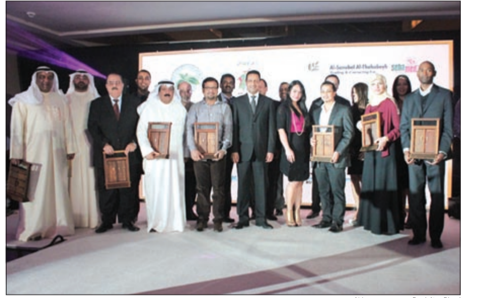
لقطة تذكارية مع عدد من المكرميين

أقام فندق سفير وريزيدنس الكويت - الفنطاس يوم السبت الموافق 6 أبريل 2013 حفل التكريم السنوي الأول لعملاء الفندق وذلك في قاعة السيف للاحتفالات وبحضور أكثر من أربع مائة من عملاء الفندق من شركات ومؤسسات خاصة وحكومية ومؤسسات إعلامية كبرى. وسلط الفندق الضوء على أكثر من أربعين شركة كانت من أكثر الشركات التي ساهمت ودعمت الفندق خلال الثلاث سنوات الماضية. الأهمية بجوها الرائع أضيفت إليها للمسات الفنية والمؤثرات الصوتية والسمعية حيث تحولت إلى مسرح تاللا بأضوائه وديكوراته المذهلة لتحول المكان إلى أمسية لا تنسى. نظم هذا الحدث شركة كوندور العالمية والتي تعد من الشركات الرائدة في تنظيم وإدارة المناسبات الكبيرة والمتميزة في المنطقة، الأمسية تخللتها تقديم فقرات فنية ومسلية متنوعة عكست المواهب التي يتمتع بها موظفو فندق سفير وريزيدنس الكويت - الفنطاس من