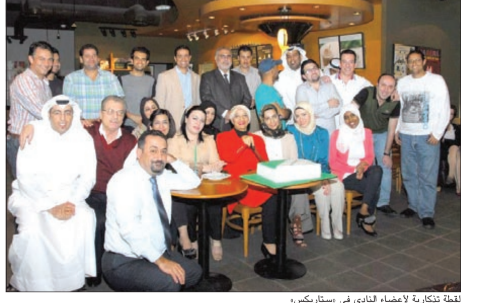
لقطة تذكارية لأعضاء النادي في «ستاربكس»

للاتصالات والمسؤولية الاجتماعية لدى ستاربكس في منطقة الشرق الأوسط وشمال أفريقيا: «إنه لمن دواعي سرورنا واعتزازنا الاحتفال بالذكرى السنوية الرابعة لنشاط اجتماعي وثقافي غاية في الأهمية في الكويت. وهذه الشراكة طويلة الأمد تؤكد التزام ستاربكس بتبسيط الضوء على ثقافة وتراث الكويت وتناجها الأدي، من خلال تشجيع أفراد المجتمع على المشاركة في اللقاءات الشهرية لأعضاء النادي، هناك المزيد من الجوانب التي يمكن استكشافها في الثقافة العربية، ونحن نتطلع إلى استمرار شراكتنا الناجحة مع النادي لسنوات عديدة مقبلة». ومن أهداف نادي ديوان للقراءة دعم أعضائه وتشجيعهم من خلال المحافل والمنتديات الأدبية والفكرية، والتطلع إلى اجتذاب الكتاب والمؤثرين والفنانين والمؤسسات الثقافية في الكويت، وتستضيف ستاربكس في فرعاها اللقاءات الشهرية التي ينظمها النادي بإدارة رئيس النادي، لتوفر منتدى يلتقي فيه أعضاء النادي الذين يربو عددهم على الأربعمائة، ومن بينهم كتاب وقناون وموظفون وطلاب، ليتبادلوا الآراء وجهات النظر حول كتاب محدد يتم اختياره شهريا. ومن الجدير بالذكر أن نادي ديوان للقراءة يرحب بالجميع في الكويت للانضمام مجانا إلى عضويته ممن تزيد أعمارهم عن 18 عاما، وذلك من خلال التسجيل عبر الموقع الإلكتروني www.diwanbooksclub.com.