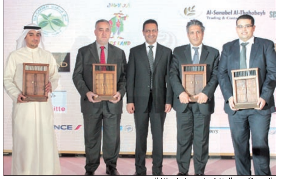
جانب من تكريم عملاء فندق سفير وريزيدنس الفنطاس