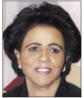
الشيخة فريحة الأحمد