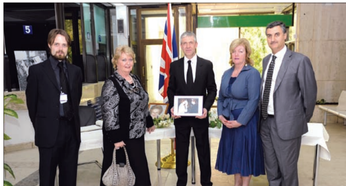
معزون في مقر السفارة البريطانية