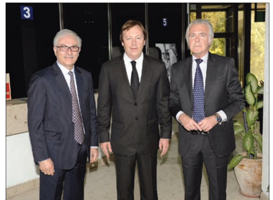
معزيا مع السفير البريطاني