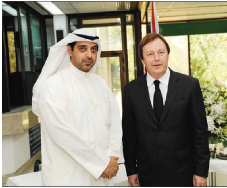
الشيخ محمد عبدالله معزيا السفير البريطاني فرانك بيكر