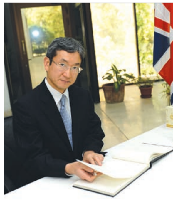
تدوين كلمة عن الراحلة