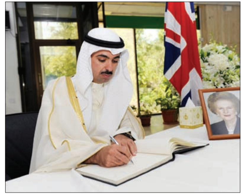
رئيس مجلس الأمة علي الراشد يدون كلمة في سجل التعازي

ليف من رجال السياسة والديبلوماسيين والشخصيات أبتوا المرأة الحديدية