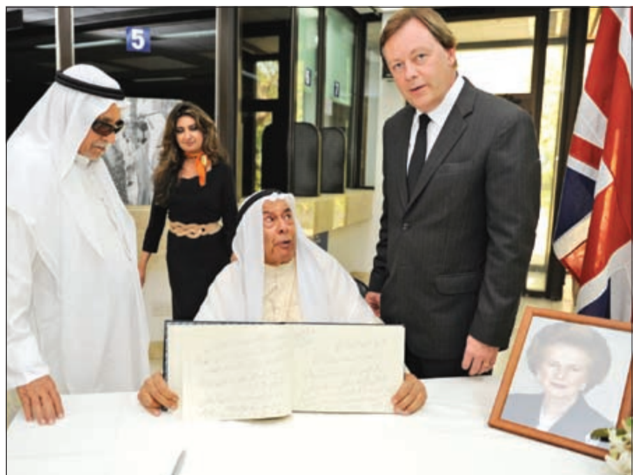
استعراض الكلمات في سجل التعازي