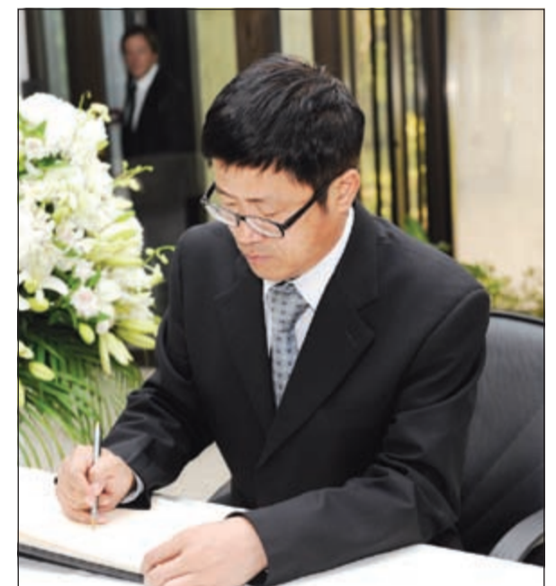
مستشار القسم السياسي بالسفارة الصينية في البلاد يدون كلمة بسجل التعازي