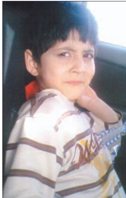
الطفل يعاني من تشنجات حرارية بدأت معه منذ أن كان عمره سنة، وقد شخصها الأطباء بحالة صرع ما جعل عدة حضانات ومدارس تعذر عن عدم استقباله