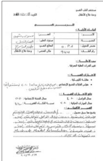
تقرير طبي بحالة الطفل