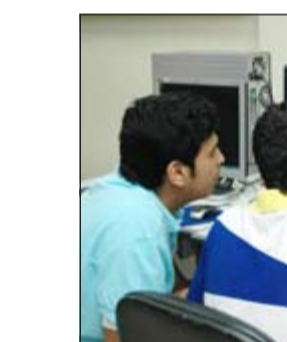
جانب من المشاركين في المسابقة

أعلنت اللجنة التنفيذية لمسابقة السيارات والأنظمة المرورية الحادية والعشرين 2013 التي ينظمها النادي العلمي بالتعاون بين وزارتي التربية والداخلية وتقام تحت رعاية النائب الأول لرئيس مجلس الوزراء ووزير الداخلية الشيخ احمد الحمود نتائج محور المعلومات الفنية الذي اعدته اللجنة التنفيذية بالتعاون مع توجيه الفني العام للدراسات العملية والخاص بكل ما يتعلق بمعلومات فنية خاصة بالمركية لتمكين الطلبة والطالبات من تشخيص الأعطال التي تطرأ على المركبة سواء كانت في المحرك أو الأجزاء الخارجية وتزويدهم بمواصفات المركبة الموضوعة من قبل الشركة المصنعة. وذكر المدير التنفيذي للمسابقة خالد الحسن ان هذه المعلومات ضرورية لتفادي الأعطال المفاجئة للمركبة على الطريق وإطالة عمر المحرك الافتراضي وقد أسفرت نتائج محور المعلومات الفنية العامة للمدارس الثانوية بنات عن الآتي: المركز الأول: ثانوية مارية القطبية بنات بمجموع 100% وزمن 38 ثانية، المركز الثاني: ثانوية زرينة بنات بمجموع 100% وزمن 39 ثانية، المركز الثالث: ثانوية اليرموك بنات بمجموع 100% وزمن 52 ثانية، المركز الثالث مكرر: ثانوية السالمية بنات بمجموع 100% وزمن 52 ثانية، كما جاءت نتائج المحور لطلاب المدارس الثانوية بنين كالآتي: المركز الأول: ثانوية جابر بن عبدالله بمجموع 100% وزمن 31 ثانية، المركز الثاني: ثانوية انس بن مالك بمجموع 100% وزمن 34 ثانية، المركز الثالث: ثانوية عروة بن الزبير بمجموع 100% وزمن 36 ثانية.