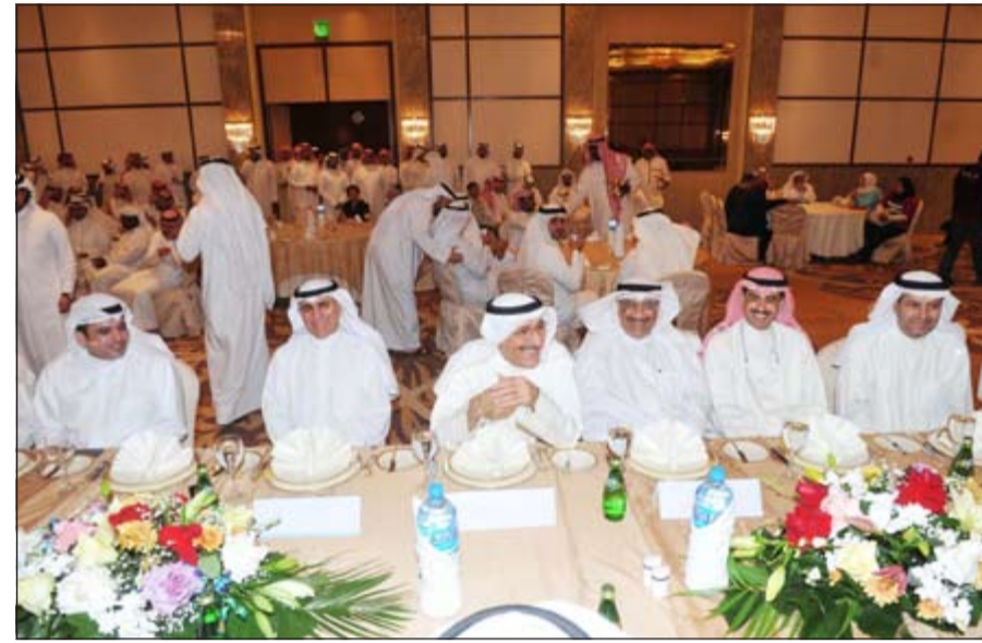
هاني حسين وفاروق الزنكي مع الحضور في الحفل

من جهته، بارك رئيس نقابة العاملين بالقطاع النفطي الخاص محمد الفضلي للعاملين إقرار حقوقهم واللائحة التنفيذية بشأن العمالة الوطنية في عقود المفاوضين، مضيفاً ان هذا الإنجاز العمالي جاء بعد جهود حثيثة، موجهة لشكر رئيس اتحاد عمال البترول والبتروكيماويات عبدالعزیز الشريان على جهوده ولوزير النفط ورئيس المؤسسة على دعمهم للمطالب العمالية المستحقة للعاملين الكويتيين في القطاع النفطي الخاص. وقال الفضلي في كلمته في الاحتفال: ان إقرار منظومة ونهج يضمن حقوق العمالة الوطنية بمنحهم امتيازاتهم التي كفلها القانون، مشيداً بالدور الكبير، معرباً عن الشكر لوزير النفط هاني حسين على جهوده للتوصل الى اللائحة الجديدة.