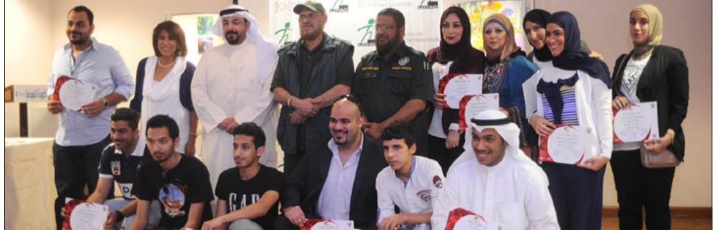
لقطة تذكارية للمشاركين بالدورة التدريبية