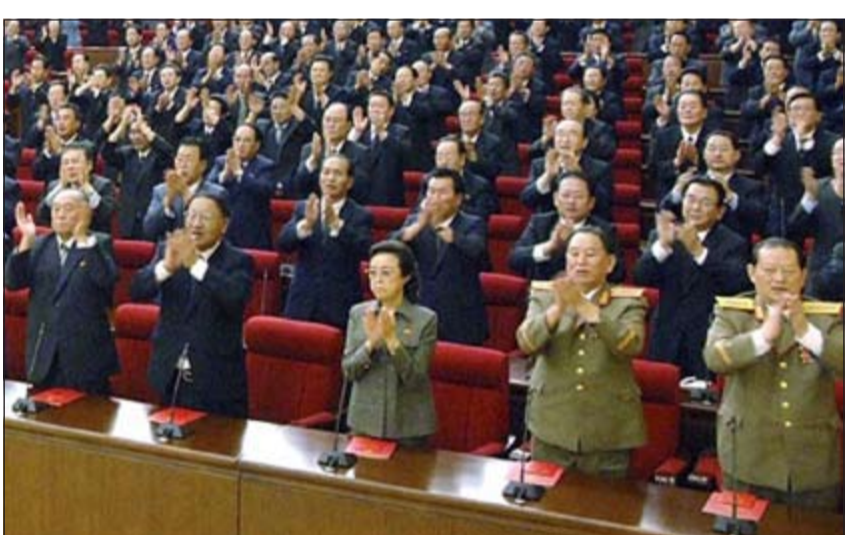
عمه يونغ أون في احد الاجتماعات

عواصم - وكالات: أعلنت شبكة فوكس نيوز الأميركية أمس ان الولايات المتحدة أجلت اختبار صاروخ باليستي عابر للقارات كان من المقرر إطلاقه خلال أيام في كاليفورنيا تجنبا لمزيد من التصعيد مع كوريا الشمالية. ونقلت امس عن مسؤول قوله ان وزير الدفاع الأميركي تشاك هامل قرر تأجيل الاختبار الصاروخي المسمى «مينوتمان 3» العابر للقارات وكان مقررا الأسبوع المقبل من قاعدة فاندنبرغ في ولاية كاليفورنيا حتى لا يفاقم الأزمة وتفاذي أي سوء فهم أو سوء تقدير في ضوء التوترات مع كوريا الشمالية. وأضاف المسؤول ان هذا الاختبار لا يتعلق بالمناورات العسكرية الكورية الجنوبية والأميركية المشتركة الجارية في تلك المنطقة والتي أثار غضب كوريا الشمالية. وقال المسؤول الذي تحدث شريطة عدم نشر اسمه ان السياسة الأميركية ستواصل تدعيم بناء واختبار قدرات الردع النووي كما ان تأجيل عملية الإطلاق ليس بسبب أي مشاكل فنية على الإطلاق. ولمنع استفزاز بيونغ يانغ أيضا، أعلن مسؤول كوري جنوبي ان كوريا الشمالية والولايات المتحدة أراجتا اجتماعا عسكريا مهما كان يفتقر ان يعقد منتصف ابريل الجاري في واشنطن يطلب من سيبول بسبب اجواء التوتر في شبه الجزيرة الكورية.