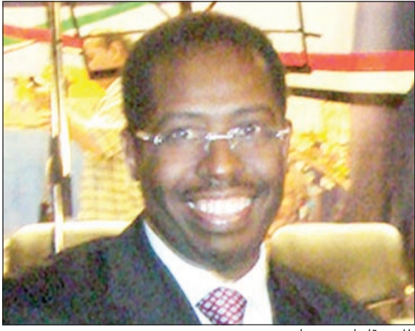
الموسيقيار احمد حمدان