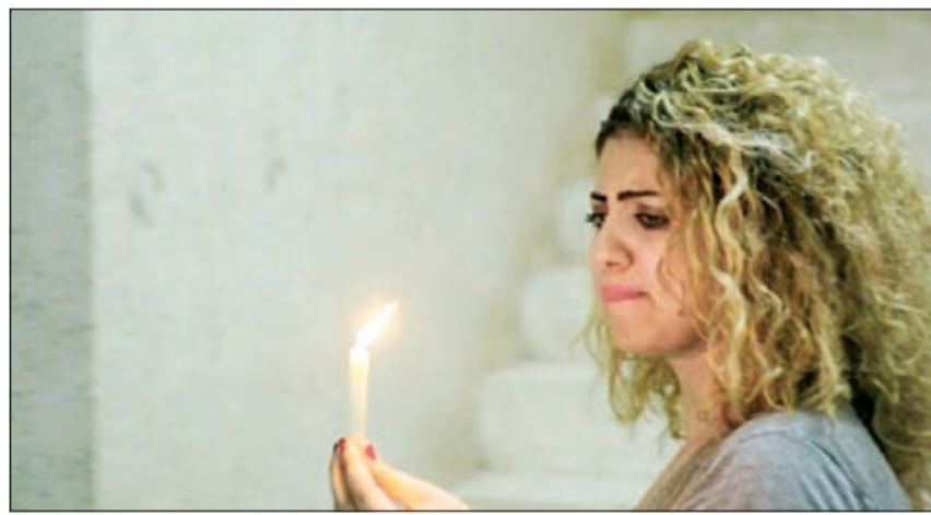
«ضحى» ولغز جريمة القتل