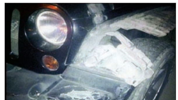
سيارة أحمد فهمي بعد تحطمها