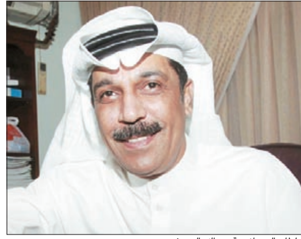
سلطان الرومانسية عبدالله الرويشد