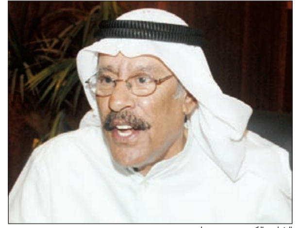
الشاعر الكبير بدر بورسلي

يحييها سلطان الرومانسية عبدالله الرويشد وعبدالرب إدريس