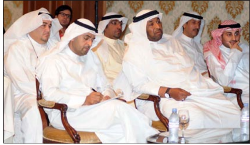
د. نايف الحجرف في مقدمة الحضور

عقدت رابطة أعضاء هيئة تدريس المعهد العالي للفنون الموسيقية، والمعهد العالي للفنون المسرحية مؤتمراً صحافياً بشأن أكاديمية الكويت للفنون، حضره وزير التربية ووزير التعليم العالي د. نايف الحجرف، الذي أشاد أعضاء هيئة التدريس بمبادراته بالمشاركة، متمنين أن تكون المرحلة المقبلة مرحلة إصلاح جذري باعتبارها دافعا وحافزا للحراك والتغيير الإيجابي في مختلف النواحي والمجالات الخاصة بأكاديمية الكويت للفنون.