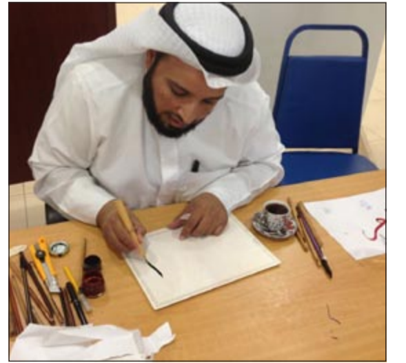
احد المشاركين في المعرض

مركز الكويت للفنون الإسلامية التابع لوزارة الاوقاف التشكيلي فريد العلي باللوحة المشاركة لطلبة الجامعة التي وجدنا بها لمسات فنية كبيرة، وهي امور تلجج الصدر، خاصة في مجال استخدام الالوان الزيتية في اللوحات الفنية وايضا استخدام الفحم في الرسم من الطلبة خلال لوحاتهم، كما ان هناك ايضا من الامور التي تم ملاحظتها وهي استخدام الظل السليم على الرغم من انهم هواة ولم يأخذوها عن طريق الدراسة، مما يشعرا اننا امام مواهب واعده يجب ان يعتنى بها في هذا المجال رغم مشاغلهم في الدراسة، وأكثر ما شدني هي لوحة «الفانوس» والتي تحتوي على عدة اركان جميلة، واقتربت على الجامعة ان يكون هناك تنافس على مستوى الجامعة والجامعات الأخرى، واذاف: اننا نطمح ان يكون هناك تعاون اكبر مع الجامعة المفتوحة، والتي يتعرض فيها زملائنا الطلبة لظلم واضح وكبير من قبل وزارة الداخلية نتيجة لتعدد تحرير المخالفات بحقهم خصوصا وأن الذنب ليس ذنبهم.