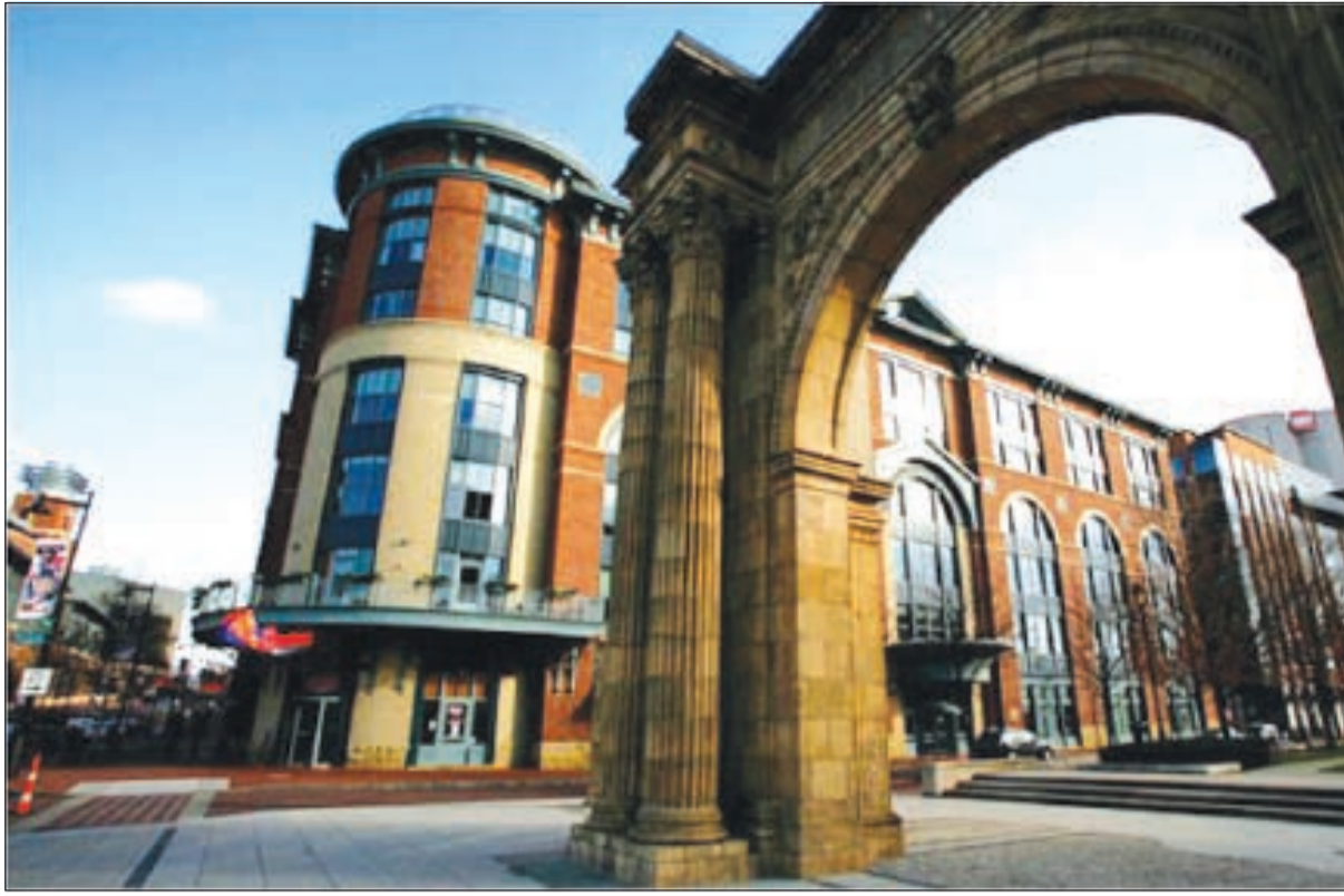
كولومبس المدينة الأميركية الوحيدة التي تنافس على اللقب

الأضواء الدولية الساطعة في الأونة الأخيرة، ان 400 مدينة حول العالم تسعى إلى شرف فوزها بصفة «مدينة المجتمع الذكي»، ويتم اختيار القوائم الأساسية على يد لجنة من الأكاديميين والخبراء في مختلف مجالات الاقتصاد والاجتماع. وتصنف هذه القوائم حتى ينحصر التنافس النهائي بين سبع مدن يتم أخيرا اختيار إحداها لنيل الصفة الكبرى، ويتم الاختيار وفقا لمعايير عالية وصارمة في منافسة مفتوحة للجميع وليست حكرا على الدول الصناعية الغنية كما ان المنافسة لا تعني مجرد القدرة على شراء التكنولوجيا المتطورة أو التمتع بمعدلات النمو الاقتصادي الأسرع في العالم.