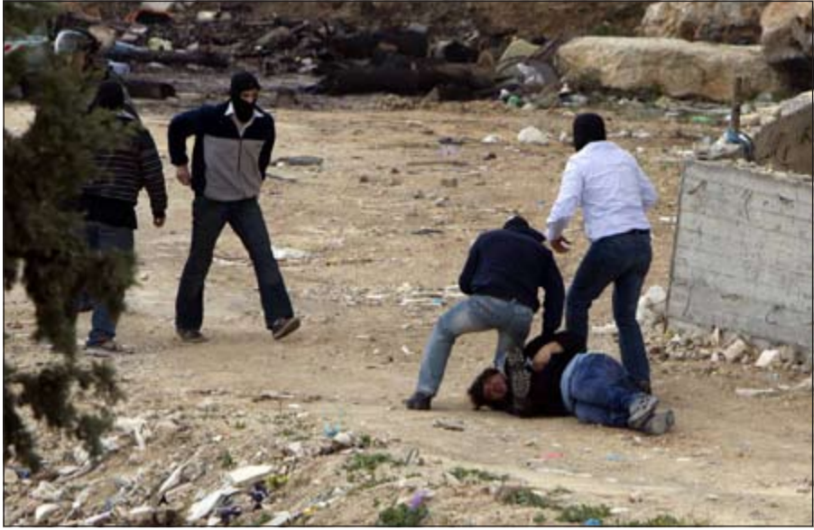
رجال شرطة إسرائيليون بلباس مدني يعتقلون متظاهراً فلسطينياً في القدس المحتلة

فانه سوف يقبل الحكومة ويشكل حكومة جديدة خلال الفترة المقبلة». وتابع المسؤول من فتح أن عباس خاطب أعضاء المجلس الثوري خلال الاجتماعات التي انتهت أمس الأول قائلاً «انني اريد على الحكومة أكثر منكم جميعاً، اما او.. ولا اريد ان اقول أكثر من ذلك لكن انتظروا ثلاثة ايام فقط». وقال المسؤول «ان أعضاء الثوري فسروا حديث عباس اما ان يعود قسيس او ان يقدم فياض استقالته او تتم اقالته».