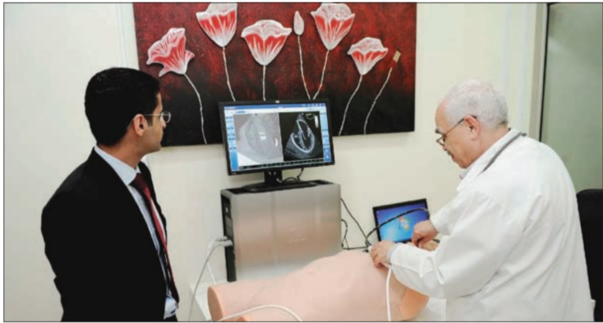
استعراض لسونار القلب الجديد في مركز سلمان الدبوس

بعد أن مارست عملي كمدير مستشفى.. هل تعتقد أن مدير المستشفى لديه الصلاحيات الكافية لإجراء التطوير الذي ينشده اي مدير ام أن اختصاصات المدير مازالت محدودة ومقيدة بالمقارنة مع المدير باستشفيات الخاصة؟ ● هناك دعم كامل ولا محدود من معالي وزير الصحة د.محمد الهيفي ووكيل وزارة الصحة د.خالد السهلاوي، ومدير