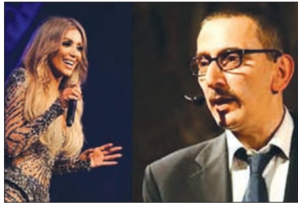
زياد الرحباني ومايا دياب

صورت الفنانة مايا دياب مع الفنان اللبناني زياد الرحباني حلقة من برنامج «بعدنا مع رابعة» الذي تعرضه شاشة الجديد وتقدمه الإعلامية رابعة الزيات. وفي سياق الحلقة، قدم الرحباني مقطعا لأغنية بصوت السيدة فيروز تبت للمرة الأولى، في ما طغت الطرافة والمزاح على أجواء الاستوديو، خصوصا أن زياد معروف بخفة دمه ونكاته وكذلك مايا. إلى ذلك، كانت مايا قد أعلنت عن عمل غنائي سيجتمعها بزياد الرحباني، وبحسب المعلومات فهو لن يكون مسجلا في الاستوديو بل عبر أداء مباشر منها كي يبرهننا معا أن لدينا موهبة غنائية لم تظهرها بعد، ومن المتوقع أن تصدر الأغنية قريبا بعدما تنتهي مايا من تصوير حلقات الموسم الثالث من «هيك منغني» وانتهاء عقدها مع محطة MTV اللبنانية. ومن المعروف أن مايا تربطها علاقة وطيدة بزياد ولطالما عبرت عن إعجابها به وبفنه وتحدثت عن الصداقة التي تجمعهما، وكذلك وصفها هو في أحد لقاءاته الصحافية بأنها لا تشبه أحد، علما أنهما سبق وتعامل معا في أغنية «ولعت كثير».