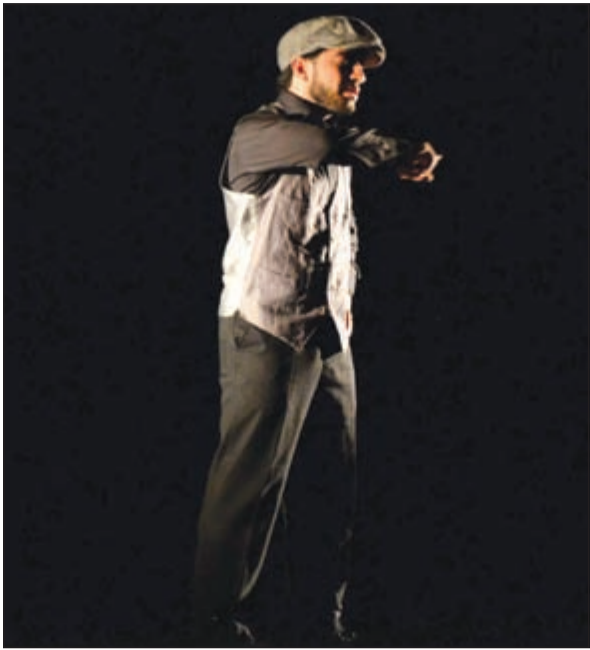
المخرج نصار النصار