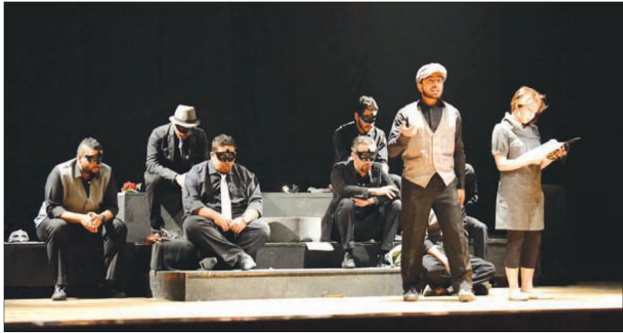
مشهد من مسرحية «رسالة إلى»

اختتمت فرقة مسرح جامعة الكويت مسرحية «رسالة إلى» عروض الدورة الثالثة من المهرجان الأكاديمي المسرحي وذلك مساء أمس الأول على خشبة الراحل حمد الرجيب وسط حضور جماهيري كبير رغم أن العرض عرض على هامش المسابقة الرسمية للعروض ولكن «الزین يفرض نفسه».