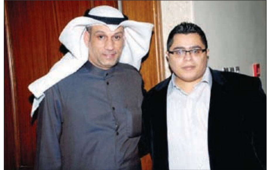
المزعل مع التمار

حاليا الى اقامة مهرجان سينمائي دولي من خلال نادي الكويت للسينما الذي تم انشاؤه منذ عام 1976 اضافة الى ائراء النادي لرواده من المهتمين بفنون السينما من خلال تكثيف الدورات التي يقيمها النادي في ورش الكتابة السينمائية والتصوير والاضاءة والتي من خلالها يتم استقطاب اعلام الفن السينمائي من مصر لتدريس الفنون السينمائية لرواد النادي والراغبين في اخذ دورات سينمائية.