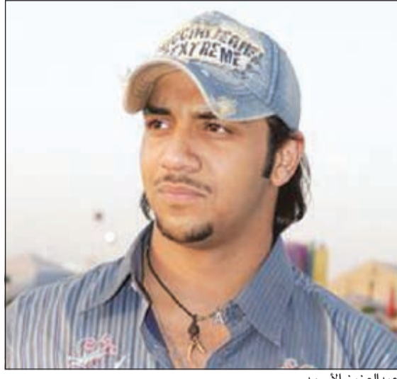
عبد العزيز الأسود

تقول كلماتها: «يا روجي عنه دني.. معاه الحب يمشي ويسولف عني.. يا روجي عنه دني» إن شاء الله تعجب الجمهور. أما عن مغادرته للبحرين فيقول: بدعوة كريمة من المخطط والراعي الرسمي «بيت شازي» سيقم في 18 من الشهر الجاري حفلاً غنائياً في فندق الخليج بقاعة المؤتمرات بمناسبة مشاركة 21 دولة وبحضور أشهر مصممي الأزياء في العالم العربي وشخصيات إعلامية، وأنا سعيد جداً بإحياء هذا الحفل الغنائي واختيارهم لي تحديداً. وكشف الأسود لـ «الأنباء» عن سر ابتعاده عن الدراما التلفزيونية